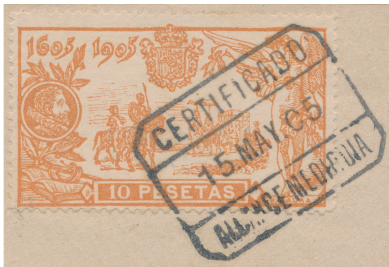
Afb. 2. De 10 peseta's, gebruikt, op fragment

gedurende de eerste paar dagen van mei 1905. Afstempelingen uit andere plaatsen met een datum uit de geldigheidsperiode zijn dan ook tamelijk schaars, en gezocht. Afbeelding 2 toont een gebruikt exemplaar van het 10 peseta's zegel. Het betrof als te verwachten een aangetekende zending ('CERTIFICADO'), gepost op maandag 15 mei 1905, de laatste dag van geldigheid, en wel via het late afgifteloket ('ALCANCE') op het Madrileense treinstation Mediodia.[3]