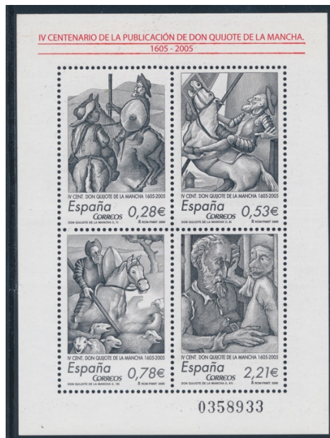
Afb. 14. 400 Jaar publicatie van de “Don Quichot”

We sluiten deze laatste bijdrage in de serie af met een overzicht, waarin opgenomen alle besproken zegels, aangevuld met wat een vluchtige inspectie van de catalogus vanaf 1999 mij in dit kader opleverde. De tabel leert ons dat er in de periode 1905-2016 minimaal 75 zegels op enigerlei wijze zijn gewijd aan het thema Don Quichot. Dat is gemiddeld bijna drie zegels elke vier jaar, overigens nogal ongelijkmatig verdeeld door de serie van 10 en vooral de twee velletjes van tezamen 24 zegels. Hoe dan ook: een waar postaal tribuut van een land aan een literair meesterwerk en zijn auteur.