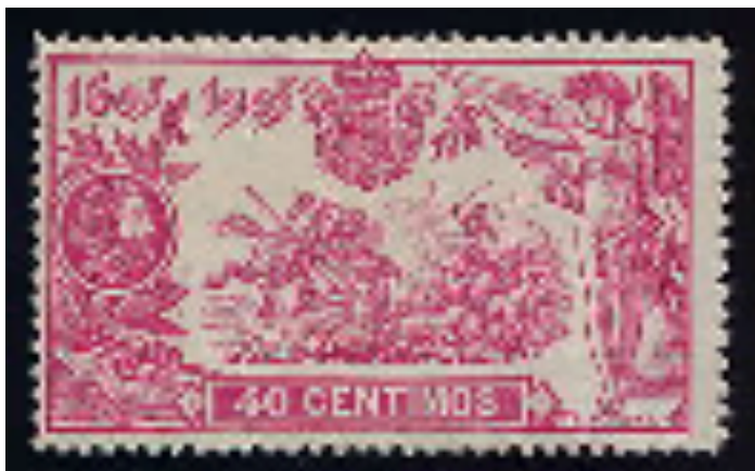
Afb. 4. Het zegel van 40 céntimos (Ed. 262)

voorbeeld hiervan. Het vaste kader van de Quijote-serie toont aan de linkerkant een portret van de schrijver in medaillevorm, omgeven door een lauwerkrans. Daaronder liggen twee attributen die met Cervantes kunnen worden geassocieerd: een zwaard en een opengeslagen boek. Linksboven staan de relevante jaartallen, 1605 en 1905. Midden-boven treft men het wapen van Spanje. Net als bij het merendeel van de eerdere Spaanse uitgaven ontbreekt de landsnaam. Aan de rechterkant staat een engelfiguur, met een lauwerkrans in zijn rechterhand, en een rol perkament in de linker. Midden-onder staat de frankewaarde, en rechtsonder de naam van de ontwerper: B. Maura. De centrale afbeelding van dit zegel toont Don Quijote die een aanval inzet op een kudde schapen, die hij aanziet voor een vijandig leger. Deze, en de andere centrale scènes zouden mijns inziens een stuk aan duidelijkheid, en de zegels aan aantrekkelijkheid hebben gewonnen, als ze in een contrasterende kleur waren uitgevoerd, bijvoorbeeld in zwart.