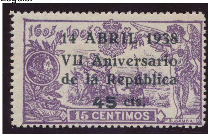
Afb. 5. Opdruk ter viering van de zevende verjaardag van de republiek

Korte tijd later, op 14 april kwam het wel tot een daadwerkelijke uitgifte, nu ter viering van de zevende verjaardag van de Tweede Spaanse Republiek. Tijden en geldgebrek waren opnieuw aanleiding tot het hergebruik van de bestaande voorraden: het 15 céntimos zegel werd overgedrukt met een aan de gelegenheid aangepaste tekst en een nieuwe frankeerwaarde van 45 céntimos (Ed. 755). Vermoedelijk was Arthur Barger - zie Iberia 127, en elders in dit blad - betrokken bij deze uitgifte. In elk geval waren ze alleen verkrijgbaar bij het kort daarvoor op Barger's initiatief opgerichte filatelistisch agentschap (A.F.O.) te Barcelona. De oplage was 2.000 vel, ofwel 100.000 zegels.