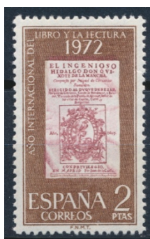
Afb. 8. Internationaal Jaar van het Boek

De UNESCO had 1972 aangewezen als het Internationaal Jaar van het Boek. Bij ministerieel decreet werd bepaald dat Spanje hier aandacht aan zou besteden middels de uitgifte van een speciale postzegel. Nogal ongebruikelijk was dat in dit decreet ook expliciet werd vermeld wat er op het zegel moest staan, iets dat veelal wordt overgelaten aan de ontwerper. Er staat, in vrije vertaling: 'een afbeelding van de titelpagina van de eerste editie van de Quijote als uitgegeven in Madrid in 1605 door Juan de la Cuesta'. Aldus geschiedde, zoals men in afbeelding 8 zelf kan vaststellen. Het is grappig dat in het genoemde decreet ook wordt gesteld dat ' esta serie constará de un solo valor de dos pesetas ' ('deze serie zal bestaan uit een enkel zegel met de waarde van twee peseta's'). Wij zouden in zo'n geval waarschijnlijk niet van een 'serie' spreken.