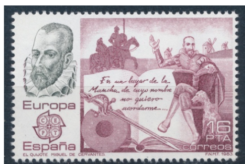
Afb. 11. Europazegel: Cervantes en Quichot

hoofdstuk 1: 'In een plaats in La Mancha, waarvan de naam me niet te binnen wil schieten ...'. Aan de horizon de onvermijdelijke windmolens.