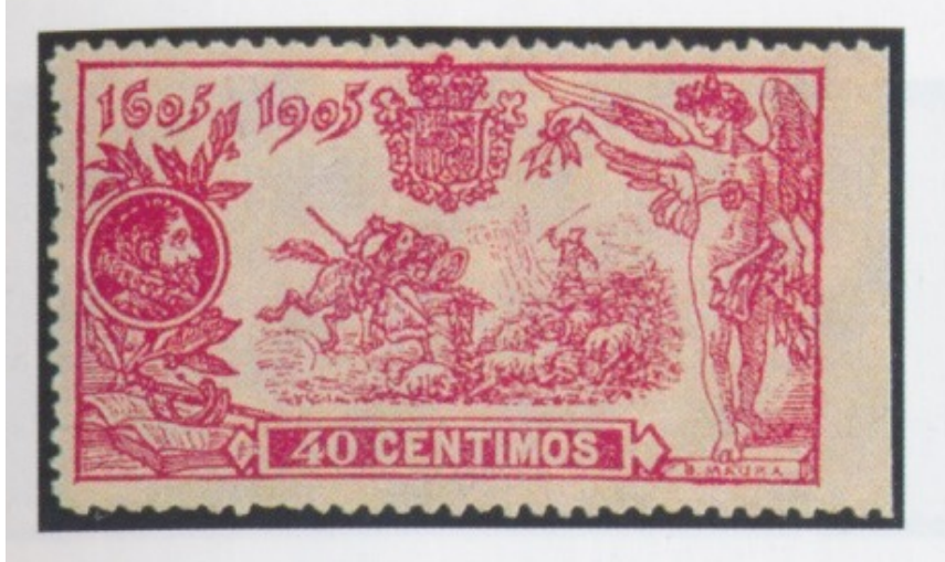
Afb. 3. 40 céntimos met rechterzijde ongetand

manipulatie. Het exemplaar in afbeelding 3 – afkomstig uit Sánchez Molto (2005: 25) – ziet er overigens wat mij betreft tamelijk overtuigend uit: