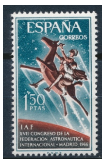
Afb. 7. XVII-e Internationale Ruimtevaartcongres

een feit dat verder niet met een Spaans zegel is gememoreerd.[2] De naam van de ontwerper schijnt onbekend te zijn, wellicht om begrijpelijke reden, want er was kennelijk veel kritiek op deze uitgifte.