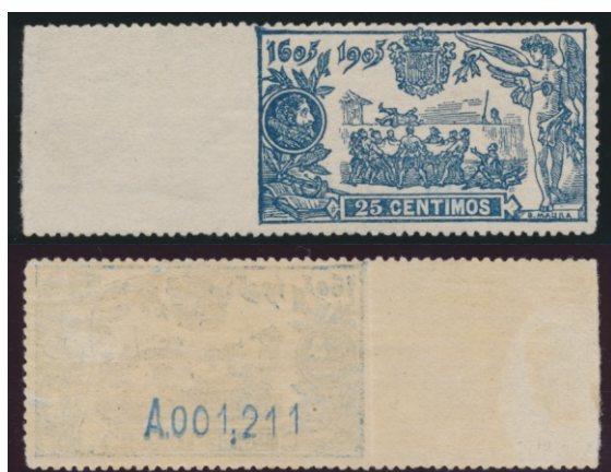
Afb. 2. De 25 céntimos, links ongetand (voor- en achterzijde)

Er bestaan exemplaren van dit zegel met ongetande linkerzijde, afkomstig van de linker velrand. Er zijn zeven velnummers bekend geworden met deze afwijking, te weten A.001,210 t/m A.001,215 en A.001,666. Zijn dit inderdaad de enige bestaande nummers, dan gaat het dus om maximaal 70 exemplaren die er van dit type in omloop kunnen zijn gekomen (Ed.260smi). Afbeelding 2 toont een exemplaar en de achterzijde ervan.