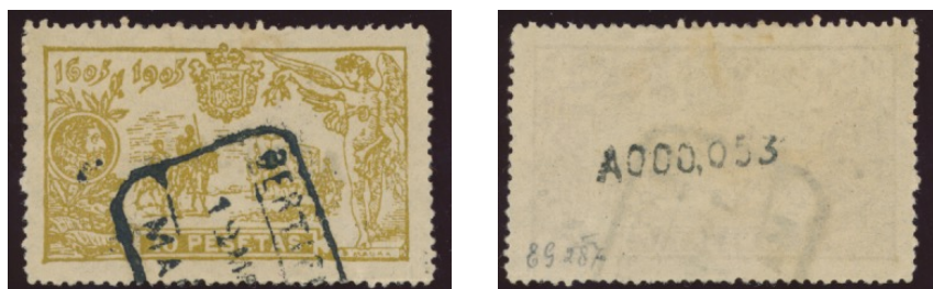
Afb. 4. Vervalsing van de 10 pts (voor- en achterzijde)

Een niet erg overtuigende vervalsing met een 'juist' nummer vindt men in afbeelding 4. De kleur ervan is nogal afwijkend: geel i.p.v. oranje. Het stempel suggereert uit de juiste periode te zijn, maar is incompleet en onverifieerbaar qua jaartal. De nummering is weliswaar binnen de reeks, want lager dan 400, maar is scheef, van een onjuist lettertype en kleur, zoals vergelijking met afbeelding 3 hierboven duidelijk maakt.