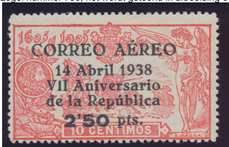
Afb. 5. De 10 céntimos met 1938 overdruk

We hebben gezien dat er na 15 mei 1905 nog grote aantallen van de Quijote-serie onverkocht waren. Dat gold met name voor de zegels met de grootste oplage: de 10 céntimos (oplage: 550.000), de 15 céntimos (oplage: 2.000.000) en de 25 céntimos (oplage: 200.000). De meeste zegels zijn, zoals we reeds eerder vermeldden, nog vele jaren in de naverkoop geweest. Maar zelfs dat leidde kennelijk niet tot volledige uitverkoop. Gebrek aan middelen als gevolg van de burgeroorlog maakte dat de Republikeinse regering de nog immer aanwezige voorraden van de drie genoemde zegels heeft gebruikt om nooduitgiften te vervaardigen, door ze te voorzien van een overdruk. De overdrukken op de 15 en 25 céntimos zullen we in de betreffende afleveringen tegenkomen. De 10 céntimos is zelfs tweemaal hergebruikt. De eerste keer was in 1938, toen een serietje van twee zegels werd uitgegeven ter viering van de 7-e verjaardag van de Republiek. De 10 céntimos werd aangewend voor de luchtpostvariant, en maar liefst 25-voudig opgewaardeerd, tot 2 pesetas 50 céntimos. In de Edifil-catalogus heeft dit zegel nummer 756; het wordt getoond in afbeelding 5.