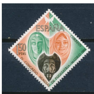
Afb. 6. IV-e Wereldcongres van de Psychiatrie

Vijf jaar later wordt in dezelfde stad het Vierde Wereldcongres van de Psychiatrie gehouden. Er verschijnt een enkel zegel, in de vanuit opklapperspectief wat ongemakkelijke vierkant-op-zijn-punt vorm.[1] Dit zegel bevat een portret van Quichot, met boven hem tweemaal Dulcinea: links als de prinses van zijn verdwaasde fantasieën, rechts als het ‘betoverde’ boerinnetje waarin hij haar meende de herkennen toen hij haar tegenkwam in deel II. Het zegt ongetwijfeld iets over de plaats van Quichot in de Spaanse cultuur dat deze afbeelding is gekozen om de psychiatrie te verbeelden. In de bovenste punt van het zegel staat verder de vlinderfiguur die we kennen van de befaamde Rorschachtest. De ongebruikelijke zegelvorm lijkt in dit geval wel degelijk te harmoniëren met de compositie van de afbeelding.