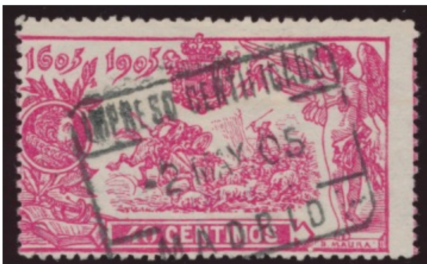
Afb. 2. Gebruikt exemplaar van de 40 céntimos

De serie was slechts te koop in Madrid, zodat het grootste deel van de afstempelingen op zegels van deze serie afkomstig is uit deze stad, met name gedurende de eerste paar dagen van mei 1905. Afstempelingen uit andere plaatsen met een datum uit de geldigheidsperiode zijn dan ook tamelijk schaars, en gezocht. Het onderstaande – helaas nogal gedecentreerde - exemplaar werd afgestempeld op 2 mei 1905 in Madrid. Het stempel vermeldt dat het ging om aangetekend drukwerk van tamelijk groot gewicht.