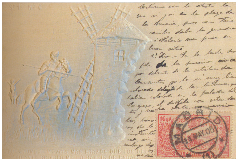
Afb. 4. Maximumkaart uit 1905 met zegel van 10 céntimos

We hebben gezien dat er na 15 mei 1905 nog grote aantallen van de Quijote-serie onverkocht waren. Dat gold met name voor de zegels met de grootste oplage: de 10 céntimos (oplage: 550.000), de 15 céntimos (oplage: 2.000.000) en de 25 céntimos (oplage: 200.000). De meeste zegels zijn, zoals we reeds eerder vermeldden, nog vele jaren in de naverkoop geweest. Maar zelfs dat leidde kennelijk niet tot volledige uitverkoop. Gebrek aan middelen als gevolg van de burgeroorlog maakte dat de Republikeinse regering de nog immer aanwezige voorraden van de drie genoemde zegels heeft gebruikt om nooduitgiften te vervaardigen, door ze te voorzien van een overdruk. De overdrukken op de 15 en 25 céntimos zullen we in de betreffende afleveringen tegenkomen. De 10 céntimos is zelfs tweemaal hergebruikt. De eerste keer was in 1938, toen een serietje van twee zegels werd uitgegeven ter viering van de 7-e verjaardag van de Republiek. De 10 céntimos werd aangewend voor de luchtpostvariant, en maar liefst 25-voudig opgewaardeerd, tot 2 pesetas 50 céntimos. In de Edifil-catalogus heeft dit zegel nummer 756; het wordt getoond in afbeelding 5.