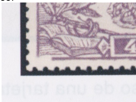
Afb. 4. De 4 peseta's: plaatfout nr. 1 (Ed. 265t)

Er zijn weinig exemplaren van dit zegel bekend met een of meer van de gebruikelijke afwijkingen, zoals dubbele plaatnummers, ongetande zijden en andere perforatiefouten. Wel bestaan er twee typen plaatfouten, een schaars verschijnsel bij deze uitgifte, in weerwil van de relatieve haast waarmee hij geproduceerd is. De eerste fout betreft een ontbrekend stukje van de kaderlijn links-onder (afbeelding 4). Dit kwam eenmaal voor per vel, en wel op positie 35.