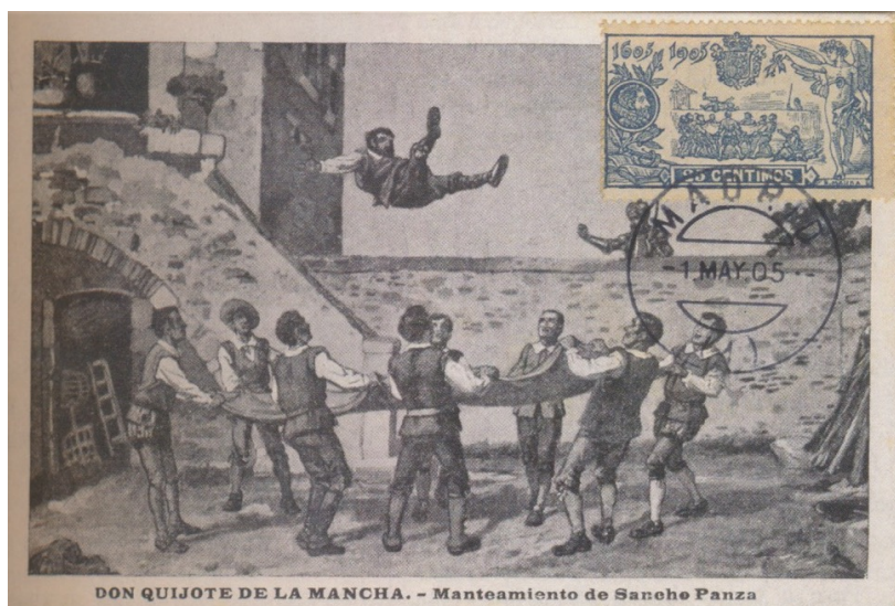
Afb. 4. Maximumkaart met zegel van 25 céntimos en vals stempel

In aflevering 2 zagen we reeds dat aan het eind van de twintiger jaren het fenomeen maximumkaart zijn intrede deed in Spanje. De waarden 5, 10, 15, 25 en 50 céntimos van de Quijote-serie waren nog lange tijd te koop bij de filatelieloketten in Madrid. Deze zijn dan ook te vinden op kaarten met een corresponderende afbeelding. Een kaart geïnspireerd op de scene van de 25 céntimos is te vinden in afbeelding 4. Contemporaine afstempelingen op dergelijke kaarten zullen dus vrijwel nooit echt zijn, alhoewel we in aflevering 4 wel degelijk een schaars voorbeeld hebben kunnen laten zien met het zegel van 10 céntimos op een kaart met een min of meer overeenkomstige scène.