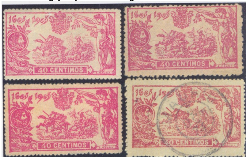
Afb. 4. Vervalsingen van de 40 céntimos; alleen links-boven is echt

Er bestaan vervalsingen van alle waarden van de gehele Quijote-serie, en uiteraard met name van de schaarse en dure hogere waarden. De bekend geworden vervalsingen zijn, als gevolg van de korte periode van frankeergeldigheid, alle filatelistisch van aard, ook indien ze zijn afgestempeld. Er bestaan dus alleen ' falsos filatélicos ', geen ' falsos postales ', vervalsingen op echt gelopen stukken. Treft men die wel aan, dan is sprake van een ' falso falso postal '. Van de 40 céntimos zijn vervalsingen bekend met velnummers A.000,196, A.000,475, A.000,908, A.001,475, A.003,176, A.003,195, A.003,206, A.005,753 en A.057,254. Alleen de eerste drie nummers vallen binnen de reeks van bestaande velnummers; die kunnen dus echt bedrieglijk zijn. Afbeelding 4 toont enkele voorbeelden van vervalsingen.