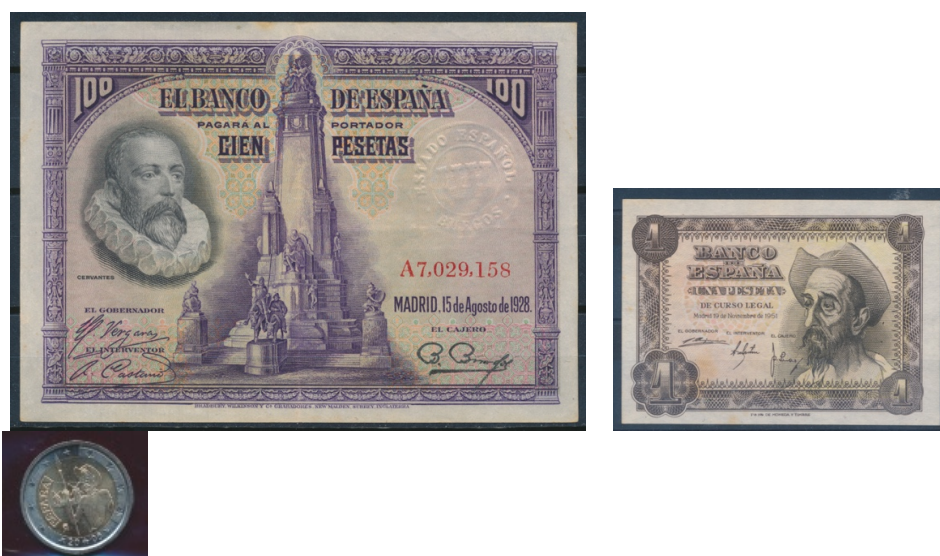
Afb. 1. Don Quichot op Spaanse bankbiljetten en €-munt (1928; 1951; 2005)

Er verscheen geen deel drie van deze ridderroman: de held was dood, en de auteur volgde zijn schepping kort na het verschijnen van deel twee. Maar daarmee was de mythe niet voorbij. Tot aan vandaag leeft Don Quichot voort, in allerlei vormen, waaronder de filatelie er slechts een is. Onze ridder verschijnt in het theater, op celluloid, op canvas, in de muziek, in uitdrukkingen in vele talen. Hij inspireerde menig andere schrijver, en met name beeldende kunstenaars, zoals Picasso en Dalí. Ook de ontwerpers van Spaanse bankbiljetten lieten zich niet onbetuigd, als te zien in afbeelding 1. Het 100 peseta biljet uit 1928 heeft een portret van Cervantes en het aan hem en zijn twee helden gewijde monument in Madrid. Het 1 peseta biljet uit 1951 toont ons het 'trieste gelaat' van Quichot. Ook de achterzijde van beide biljetten heeft een Quichot-thema. Een Spaanse €2 munt uit 2005 toont Quichot met windmolens op de achtergrond.