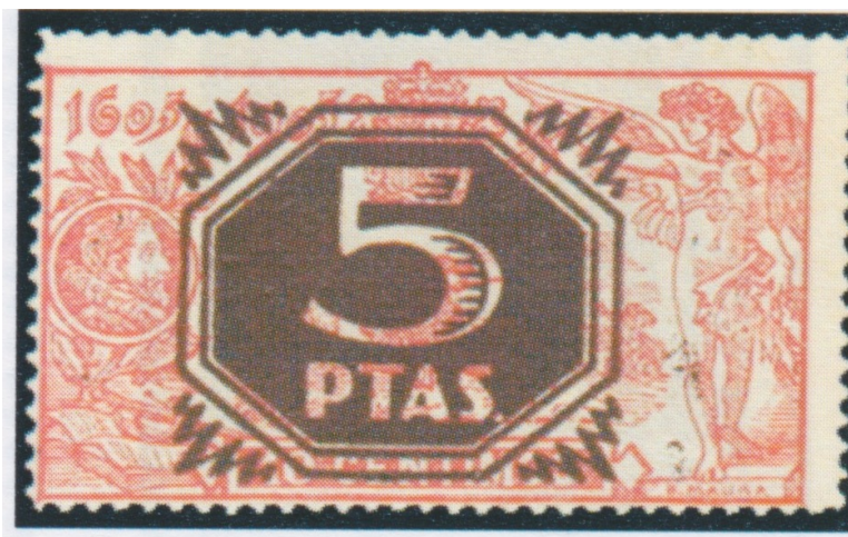
Afb. 6. De 10 céntimos met 1939 overdruk

In 1939 kwam het tot een tweede nooduitgave middels overdruk, nu in de vorm van een serie van drie, met een van elk van de genoemde zegels. De 10 céntimos werd ditmaal zelfs 50 keer opgewaardeerd, tot 5 pesetas. Er werden 300 vellen overgedrukt, in totaal 15.000 zegels. Daarvan werden slechts 650 exemplaren verkocht. Het restant werd vernietigd, en wel bij decreet van 9 mei 1949, dus onder het Nationalistisch Franco-bewind. Van in elk geval de volgende velnummers zijn exemplaren van deze tweede overdruk op de 10 céntimos bekend: A.010.217, A.010.220, A.010.300, A.010.315, A.010.317, A.010.495 en A.010.496. Men was voornemens dit zegel vanaf 1 februari 1939 frankeergeldigheid te geven, maar daar is het niet van gekomen. Het staat dan ook te boek als No Expendido, en kreeg Edifil nummer NE36. Men mag gevoeglijk aannemen dat de motivatie van deze uitgave, vooral ook gezien de ongewoon hoge nieuwe waarde, voornamelijk was ingegeven door financiële motieven, begrijpelijk zo tegen het einde van de alles verwoestende burgeroorlog (1936-1939).