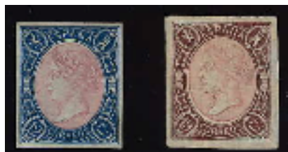
Afb. 3. De eerste daadwerkelijk tweekleurige uitgaven van Spanje

Verder zijn de zegels van de Quijote-serie monochroom, elk met zijn eigen kleur. Ook dat was tot dan toe gebruikelijk voor Spaanse zegels, zij het met enkele uitzonderingen. De zegels van de schildseries uit 1854 (Ed. 28-31) en 1855 (Ed. 35-38) combineren een zwart wapen met verschillende achtergrondkleuren. De series met koningin Isabel II van 1860, 1862 en 1864 zijn gedrukt op (niet-blank) papier, waarvan de kleur afwijkt van de kleur van de afbeelding zelf. En er zijn enkele uitgaven die daadwerkelijk meerkleurig genoemd kunnen worden: de 12 en de 19 cuartos uit 1865 (Ed. 70, 71; zie afbeelding 3), en hun getande evenknieën uit hetzelfde jaar (Ed. 76, 77).