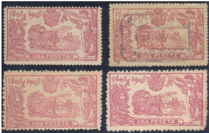
Afb. 3. Enkele vervalsingen van de 1 peseta

Van dit zegel zijn zelfs blokken van vier valse zegels in omloop gebracht, als te zien in afbeelding 4.