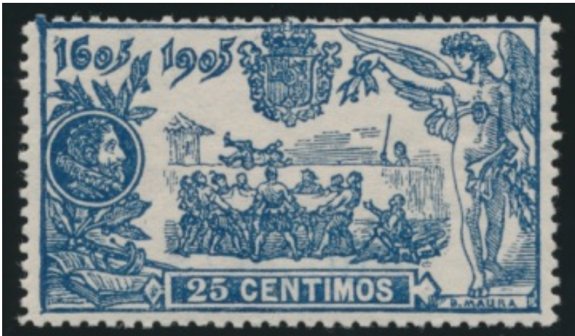
Afb. 1. Sancho wordt gejonast

Edifil nummer: Ed. 260 (zelfde nummer in Anfil en Filabo, Galvez nr. 333, Yvert 229, Michel 223, Scott 290, Stanley Gibbons 310).