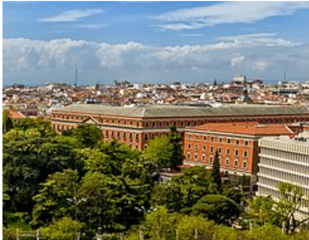
Afb. 3 Palacio de Buenavista, Madrid

Gezien de zwarte omlijsting ging het om een rouwbrief. Maar de inhoud en afzender ontbreken, dus over wie de overledene was moeten we in het ongewisse blijven. De geadresseerde, voluit: Vicente Martitegui y Pérez de Santamaría, was inderdaad een Spaanse Minister van Oorlog - 'Defensie' zouden we heden ten dage zeggen - en wel tweemaal: van 20 juli tot 5 december 1903, en nogmaals van 27 januari tot 23 juni 1905.[4] Tijdens die tweede korte ambtsperiode ontving Martitegui dus de getoonde brief op zijn kantoor. Het zal dus wel een formele en niet een persoonlijke kennisgeving zijn geweest.