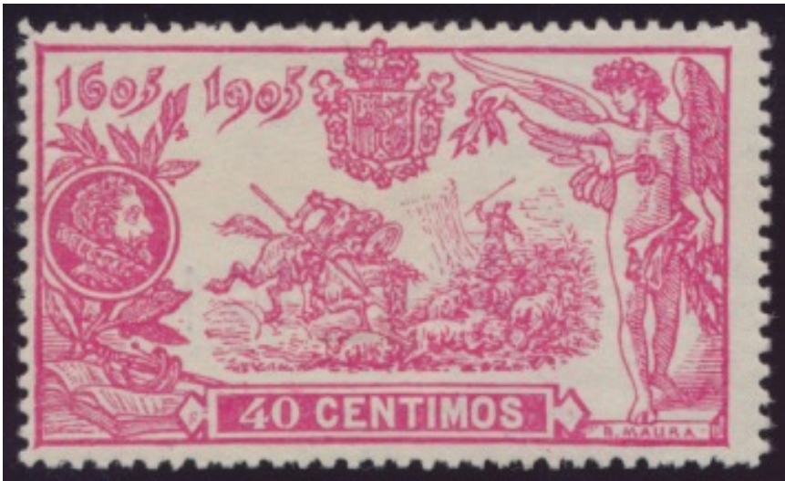
Afb. 1. De aanval op de kudde schapen

Edifil nummer: Ed. 262 (zelfde nummer in Anfil en Filabo, Galvez nr. 335, Yvert 231, Michel 225, Scott 292, Stanley Gibbons 312).