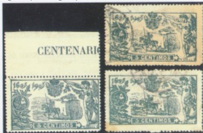
Afb. 5. Vervalsingen; het linker exemplaar is echt

Er bestaan vervalsingen van alle waarden van de gehele serie. Die zijn, als gevolg van de korte periode van frankeergeldigheid, alle filatelistisch van aard, ook indien ze zijn afgestempeld. Er zijn dus geen 'falsos postales', vervalsingen op echt gelopen stukken.