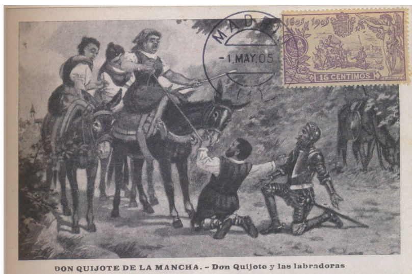
Afb. 3. Maximumkaart met zegel van 15 céntimos met vals stempel

In aflevering 2 zagen we reeds dat aan het eind van de twintiger jaren het fenomeen maximumkaart zijn intrede deed in Spanje. De waarden 5, 10, 15, 25 en 50 céntimos van de Quijote-serie waren nog lange tijd te koop bij de filatelieloketten in Madrid. Deze zijn dan ook te vinden op kaarten met een corresponderende afbeelding, zij het dus van lang na de geldigheidsperiode. Zo ook van de 15 céntimos.