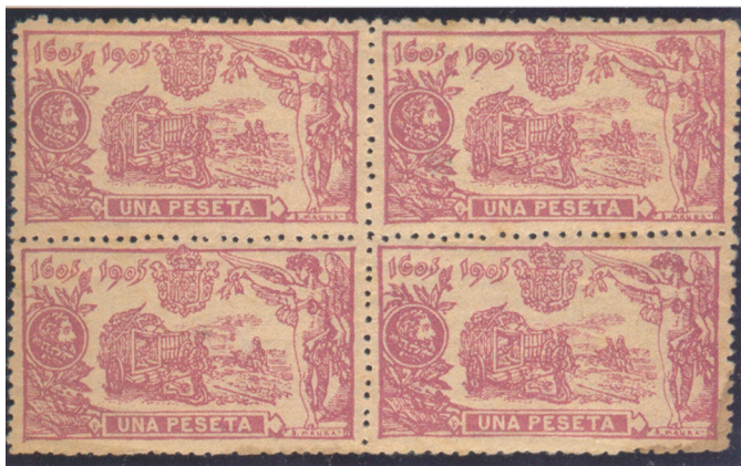
Afb. 4. Vervalst blok van vier zegels

Van dit zegel zijn zelfs blokken van vier valse zegels in omloop gebracht, als te zien in afbeelding 4.