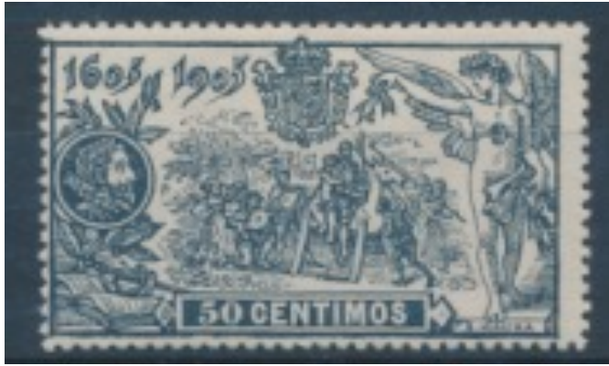
Afb. 1. Clavileño, het houten paard

Edifil nummer: Ed. 263 (zelfde nummer in Anfil en Filabo, Gálvez nr. 336, Yvert 232, Michel 226, Scott 2944, Stanley Gibbons 313).