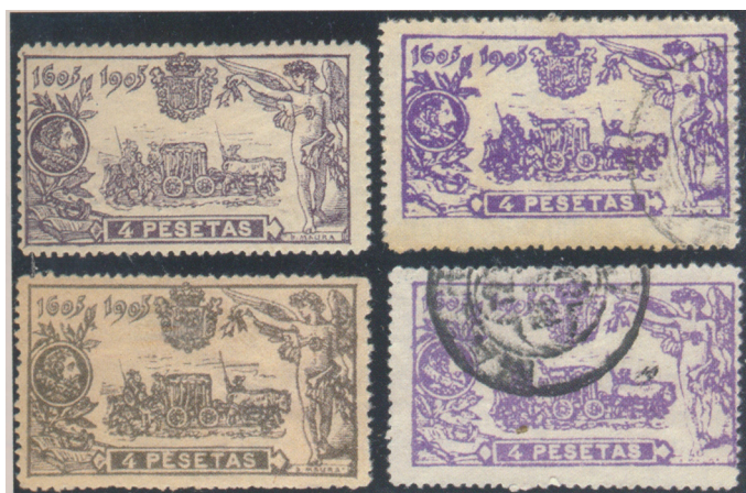
Afb. 6. Enkele vervalsingen van de 4 peseta's

waarbij opvalt dat kleur en formaat sterk afwijken van het origineel links-boven. Alleen het exemplaar links-onder komt enigszins in de buurt.