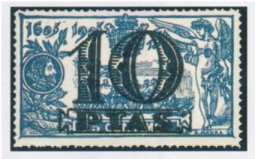
Afb. 5. Overdruk 10 peseta's op 25 céntimos

voorzien van een overdruk. Vlak voor het einde van de oorlog ontstond behoefte aan zegels met waarden 1,25 peseta's (het verhoogde brieftarief), en hoge waarden 5 en 10 peseta's. Voor die laatste waarde werden voorraden van de vellen van het 25 céntimos zegel aangewend. Daarvan werden in totaal 800 vellen (40.000 zegels) overgedrukt bij drukkerij Oliva de Vilanova in Barcelona, die op 1 februari 1939 in omloop zouden worden gebracht. Op 26 januari echter namen de nationalistische troepen onder generaal Franco de stad in. Tot een uitgifte is het daardoor niet meer gekomen. Naar schatting 13 vellen, of wel 650 zegels, zijn hiervan desondanks op de markt terecht gekomen. Edifil catalogiseert ze onder nummer N(o)E(xpendido)37. Geattesteerd zijn in elk geval zegels met velnummers A.002,518, A.002,519, A.002,527 en A.002,528.