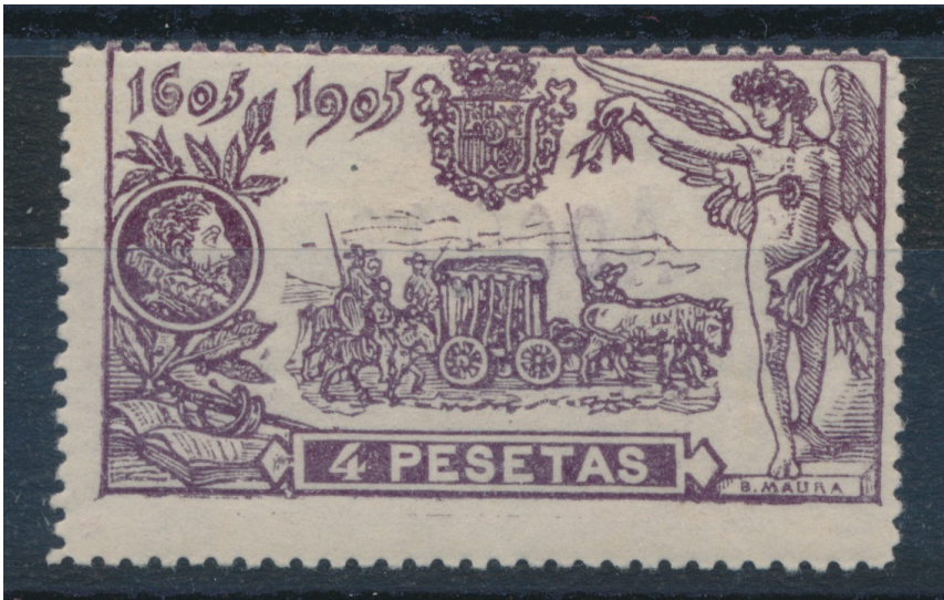
Afb. 1. Don Quichot en de wagen des doods

Edifil nummer: Ed. 265 (zelfde nummer in Anfil en Filabo, Gálvez nr. 338, Yvert 234, Michel 228, Scott 295, Stanley Gibbons 315).