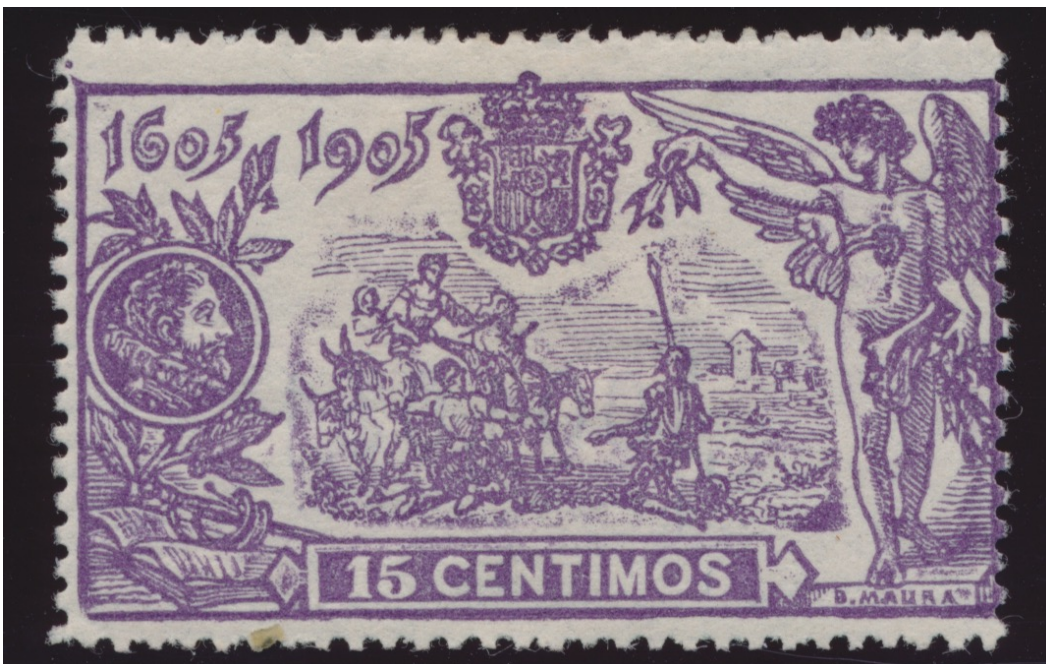
Afb. 1. Don Quichot ontmoet Dulcinea

Edifil nummer: Ed. 259 (zelfde nummer in Anfil en Filabo, Galvez nr. 332, Yvert 228, Michel 222, Scott 289, Stanley Gibbons 309).