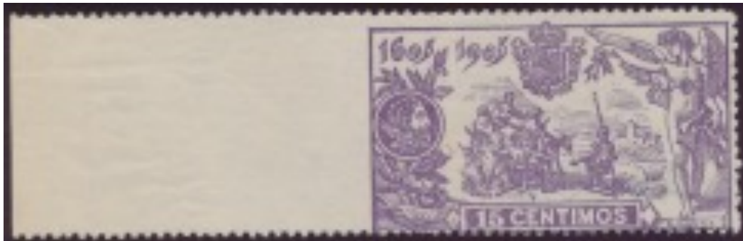
Afb. 2. 15 céntimos met linkerzijde ongetand

Vierzijdig ongetande exemplaren zijn waargenomen, maar waarschijnlijk gemanipuleerd.