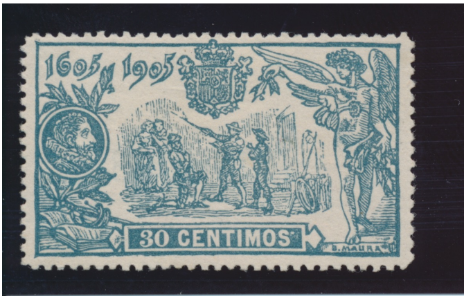
Afb. 1. Don Quichot wordt tot ridder geslagen