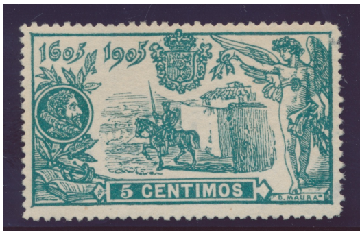
Afb. 2. Don Quichot trekt er op uit

Edifil nummer: Ed. 257 (zelfde nummer in Anfil en Filabo, Galvez nr. 330, Yvert 226, Michel 220, Scott 287, Stanley Gibbons 307).