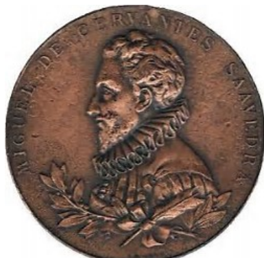
Afb. 2. Medaille ter herdenking van 300 jaar Don Quijote