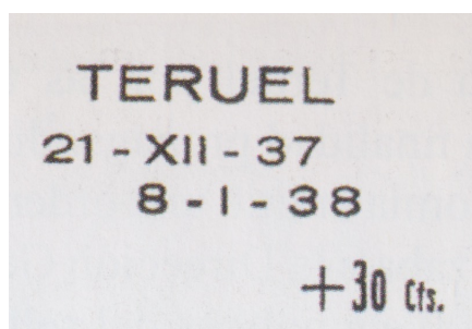
Afb. 4. Opdruk ter herinnering aan de herovering van Teruel

10, 15 en 25 céntimos, die de grootste oplagen hadden. Tariefwijzigingen en een gebrek aan middelen om nieuwe zegels te ontwerpen en te drukken noopte de republikeinse regering om deze voorraden aan te spreken, en ze te voorzien van een overdruk met de actuele tarieven. Zo was de bedoeling dat op 22 februari 1938 een speciaal zegel zou verschijnen ter ere van de herovering van Teruel een maand eerder. Hiertoe werd het Quijote-zegel van 15 céntimos voorzien van de opdruk in afbeelding 4, inclusief opwaardering tot het inmiddels geldende tarief voor binnenlandse brieven van 45 céntimos.