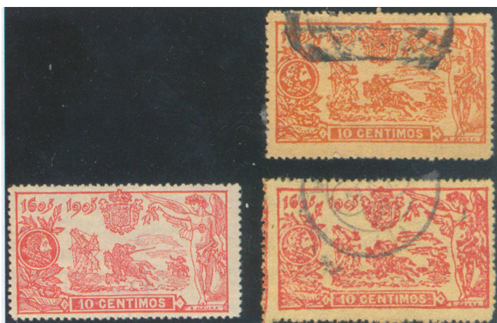
Afb. 2. Vervalsingen; het linker exemplaar is echt

Er bestaan vervalsingen van alle waarden van de gehele serie. Die zijn, als gevolg van de korte periode van frankeergeldigheid, alle filatelistisch van aard, ook indien ze zijn afgestempeld. Er zijn dus geen 'falsos postales', vervalsingen op echt gelopen stukken. Er zijn vervalsingen van de 10 céntimos bekend met het nummers A.001,922, A.003,206, A.003,543, A.006,011, A.00-,261, A.008,866 en A.057,027. De laatste is buiten de reeks van de echte velnummers, en dus per definitie vals.