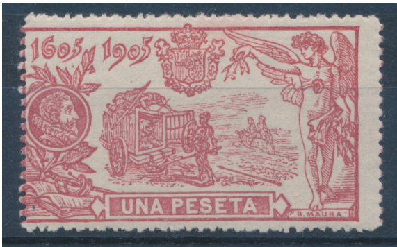
Afb. 1. Don Quichot en de leeuwenkooi

Edifil nummer: Ed. 264 (zelfde nummer in Anfil en Filabo, Gálvez nr. 337, Yvert 233, Michel 227, Scott 2945, Stanley Gibbons 314).