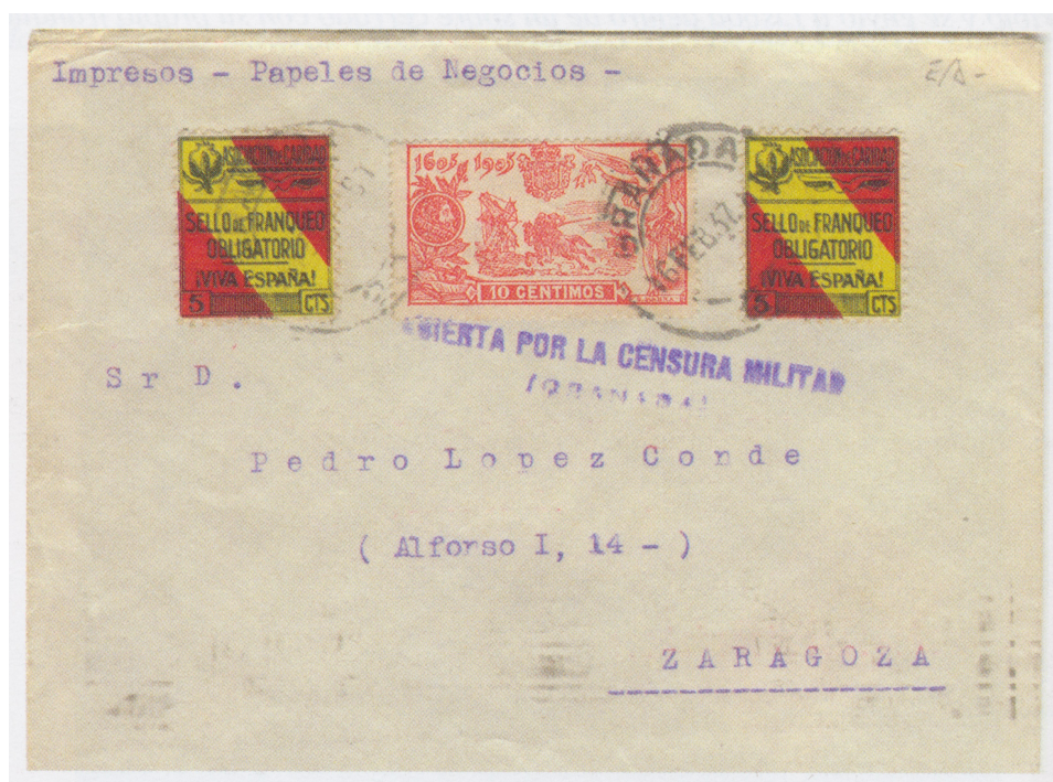
Afb. 7. De 10 céntimos op een brief uit 1937

Een curiosum is te vinden in afbeelding 7. Deze brief is afgestempeld op 16 februari 1937. Hij is gestuurd vanuit Granada naar Zaragoza, beide steden op dat moment reeds in handen van de Nationalisten. Naast twee verplichte toeslagzegels van 5 céntimos is de brief gefrankeerd met het Quijote-zegel van 10 céntimos. Zoals eerder aangegeven was dit zegel was reeds 32 jaar niet meer geldig voor frankering, maar het gebruik is kennelijk toch toegelaten, vermoedelijk wegens gebrek aan beschikbare zegels.