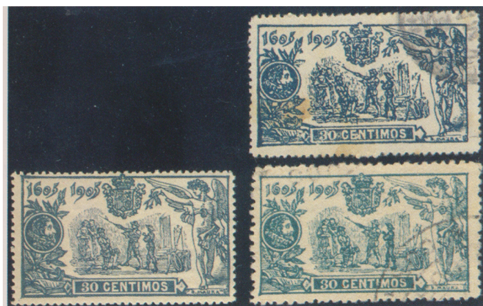
Afb. 3. Vervalsingen; het linker exemplaar is echt

ook indien ze zijn afgestempeld. Er zijn dus geen 'falsos postales', vervalsingen op echt gelopen stukken.