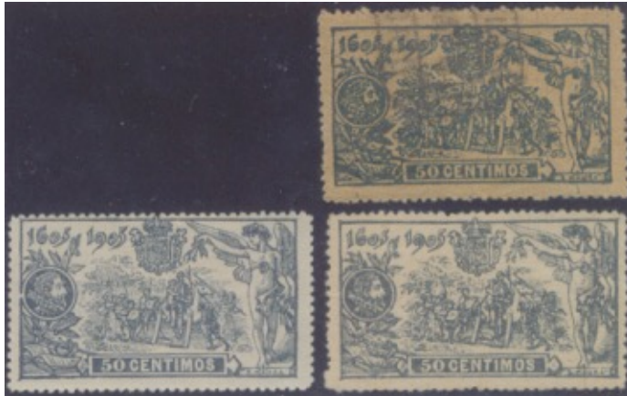
Afb. 3. Enkele vervalsingen van de 50 céntimos

Tot hier over het zegel zelf. Nu het verhaal achter de afbeelding.