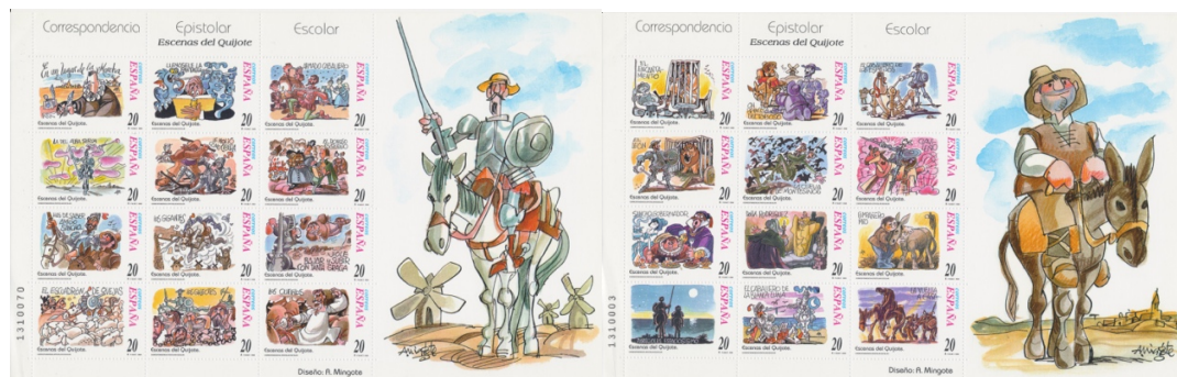
Afb. 13. Scholieren schrijven elkaar: 24 scènes uit de Don Quichot

volgende jaren in het kader van een project om scholieren te stimuleren elkaar brieven te schrijven; een initiatief dat sinds die tijd geleidelijk is achterhaald door de komst van het internet, email, WhatsApp en wat niet al. De zegels waren 5 peseta's goedkoper dan het geldende brieftarief, en mochten alleen door scholieren worden gebruikt voor het beoogde doel.