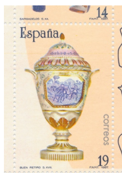
Afb. 12. Ceramiek: afbeelding Quichot en Sancho

Als de spreekwoordelijke klap op de vuurpijl werden in 1998 de twee velletjes uit afbeelding 13 gepresenteerd. Ze verschenen in dat jaar en de vier