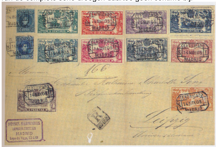
Afb. 2. Aangetekende brief naar Duitsland met de gehele serie

de langlopende 'cadete'-serie. Die zorgden met hun 75 céntimos voor de juiste porto voor een aangetekende brief naar Duitsland. De 16,75 peseta's van de complete serie droegen daartoe geen céntimo bij.