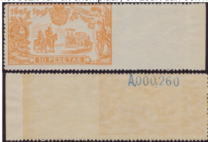
Afb. 3. De 10 peseta's, rechts ongetand (voor- en achterzijde)

per vel betekent dit dus 80 van dergelijke zegels, waarvan er ongetwijfeld een aantal verloren is gegaan. Ondergetekende prijst zich dan ook gelukkig met het bezit van dit exemplaar, en zeurt dan ook niet over de matige centrering.