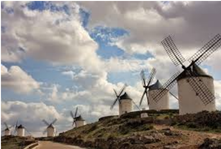
Afb. 8. Windmolens in La Mancha

Later die dag bereiken Quichot en Sancho een open vlakte. Daar zullen ze het avontuur beleven dat vermoedelijk het bekendste is van de vele avonturen die later nog hun deel zullen zijn, en dat in veel talen spreekwoordelijk is geworden. Verspreid in de vlakte staat een groot aantal windmolens. Omdat er weinig wind is, staan alle wieken stil.