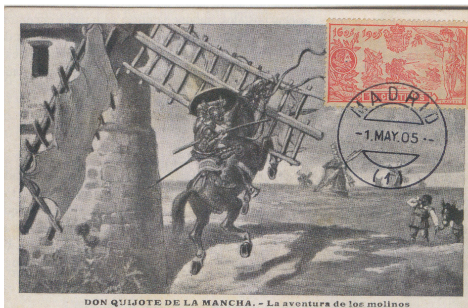
Afb. 3. Maximumkaart met zegel van 10 céntimos en vals stempel

Uiteraard zijn er geen echt gelopen kaarten: de frankeergeldigheid was reeds lang verlopen. Afbeelding 3 toont een maximumkaart met de 10 céntimos, met een (uiteraard) valse afstempeling, en nog wel eentje van de allereerste dag.