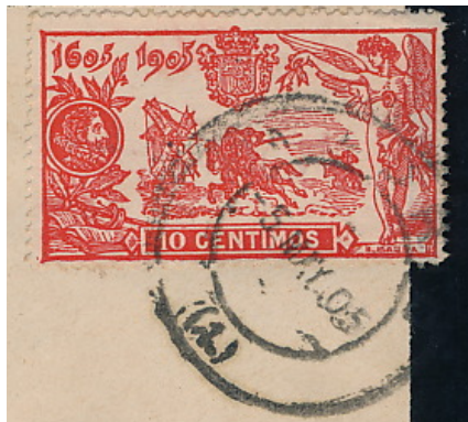
Afb. 2 Envelop met Quijote 10 céntimos, en detail van zegel en stempel (Ed. 258)