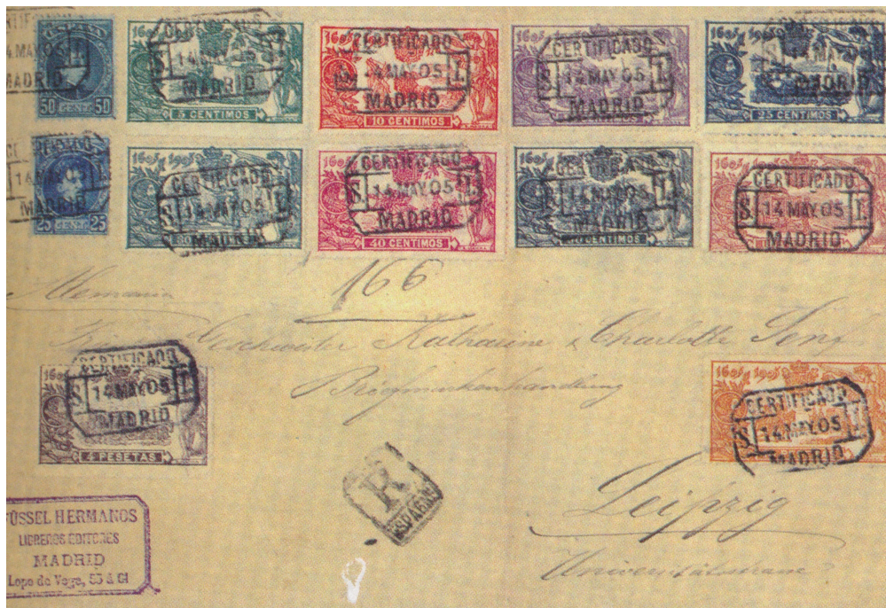
Afb. 2. De hele serie op een brief naar het buitenland

Afbeelding 2 hieronder toont een gelopen stuk met de complete serie, gestuurd op 14 mei 1905 naar Leipzig, Duitsland. Deze frankering, hoewel juist binnen de periode van geldigheid, was dus feitelijk ongeldig, gezien de buitenlandse bestemming. Dit wordt echter goedge maakt door de twee 'cadete' zegels (Ed. 248 en 252) links op de brief, tezamen 75 centimos, en voldoende voor aangetekende verzending naar het buitenland.