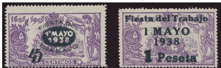
Afb. 6. Overdruk ter viering van de Dag van de Arbeid

de Arbeid, op 1 mei. Van het eerste zegel werden 200.000 exemplaren gedrukt, van het tweede 100.000. Van beide exemplaren, wederom uitsluitend verkrijgbaar bij de A.F.O. in Barcelona, werd slechts de helft van de oplage verkocht. Van beide zijn deels en geheel ongetande exemplaren bekend, alsmede verschillende fouten in de opdrukken, waaronder een variant van de 45 céntimos in rode inkt.