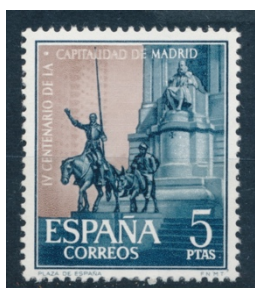
Afb. 5. Cervantes-monument in Madrid

vandaag is. De aan dit 400-jarig jubileum gewijde serie bestaat uit zes zegels. Een ervan toont het portret van Philips II. De overige vijf hebben Madrileense gebouwen en monumenten tot onderwerp. De hoogste waarde van de serie, 5 pesetas, toont het monument voor Cervantes, dat ook centraal staat op het 100 pesetas biljet in afbeelding 1. Het zegel, te vinden in afbeelding 5, heeft vooral oog voor Quichot en Sancho.