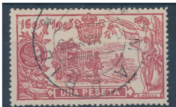
Afb. 2. De 1 peseta met geldige afstempeling

dus gezocht. Afbeelding 2 toont een exemplaar van de 1 peseta, afgestempeld in Madrid op de allerlaatste dag.