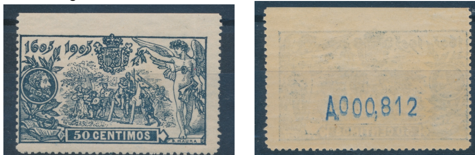
Afb. 2. Exemplaar van de 50 céntimos met ongetande bovenzijde

Volgens de Edifil I (2008) zijn van dit zegel geen exemplaren bekend met ongetande bovenzijde. In de betreffende rubriek wordt slechts de 15 céntimos genoemd. Sánchez Molto (2005: 26) echter vermeldt dat daarnaast dat ook exemplaren van de 50 céntimos gesignaleerd zijn met ontbrekende boventanding. Deze zouden dan afkomstig zijn van het vel met nummer A.000,182. In mijn collectie bevindt zich het exemplaar uit afbeelding 2 met hetzelfde mankement, maar dan met rugnummer A.000.812. Het gaat hier dus òf om een (zet?)fout in Sánchez Molto, òf om een nog onontdekt exemplaar, òf om een heel goede vervalsing door iemand die de literatuur kende maar een kleine slordigheid beging. Voor mijn eigen gemoedsrust ga ik voorslagnog uit van het eerste.