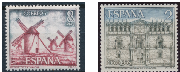
Afb. 9. De windmolens van La Mancha, en Universiteit van Alcalá

wellicht enigszins vergezocht ook een zegel uit de serie van 1966 op te voeren, met daarop een afbeelding van de universiteit van Alcalá de Henares, de geboorteplaats van Cervantes. Ik plaats hem er toch bij, in afbeelding 9, indachtig de echte thematische verzamelaar, al ligt de Quichot-connectie met de windmolens zonder twijfel meer voor de hand.