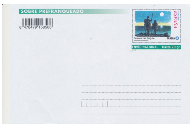
Afb. 13. Voorgefrankeerde envelop met Quichot-thema

Een nauwgezet onderzoek zal ongetwijfeld meer relevante exemplaren aan het licht brengen voor de toegewijde thematische verzamelaar, die zijn net wat ruimer uitwerpt dan ik hier heb gedaan. Naast gewone zegels zijn er dan verder nog automaatetiketten, briefkaarten en voorgefrankeerde enveloppen met het portret van Cervantes en scènes uit het boek, zoals de romantisch aandoende versie in afbeelding 13.