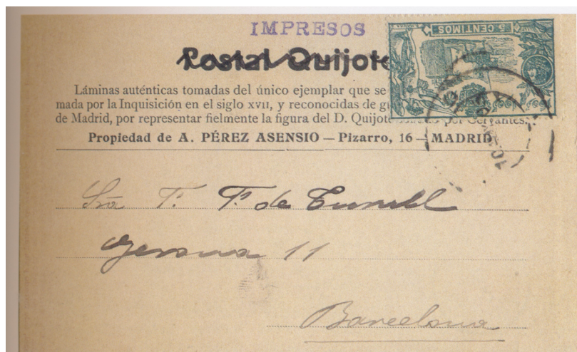
Afb. 3. Ed. 257 op drukwerk

Afbeelding 3 hieronder toont een gelopen poststuk met dit zegel, op zijn kop opgeplakt, verstuurd van Madrid naar Barcelona op 10 mei 1905. Merk op dat deze oorspronkelijke Ansichtkaart, uitgegeven in het kader van de Don Quichot-herdenking, met behulp van pen en schrijfmachine is omgetoverd in drukwerk, om op het tarief van 5 céntimos uit te komen, waar anders 10 céntimos zou moeten worden geplakt.