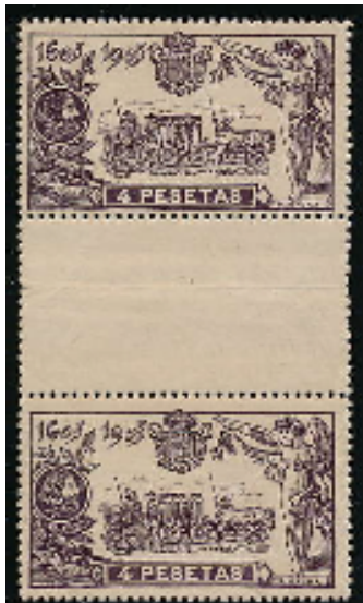
Afb. 5. Brugpaar van het zegel van 4 pesetas (Ed. 265)

Gezien de restrictieve verkoopbepalingen zal het geen verbazing wekken dat er op 15 mei nog grote aantallen onverkochte zegels over waren. Men is dan ook nog vele jaren doorgedaan met deze tegen de frankewaarde te verkopen aan de filatelieloketten in Madrid. De meeste zegels van de serie bleven zelfs te koop tot in de jaren 20, met uitzondering van de 30c, 40c en 1p. Dat laatste is overigens te zien aan de huidige catalogusprijzen voor deze drie zegels. Een deel van de overgebleven oplage van de 10c, 15c en 25c is door de republikeinse regering in 1938 en 1939, ten tijde van de burgeroorlog dus, weer in omloop gebracht, zij het overgedrukt met nieuwe waarden. Of er daarna nog zegels over waren, en of die vervolgens zijn vernietigd is niet bekend.