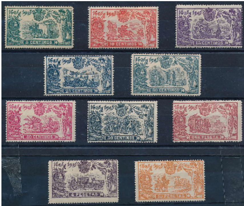
Afb. 1. De Quijote-serie van 1905

In tien volgende afleveringen wil ik telkens een van deze zegels behandelen, middels een samenvatting van het hoofdstuk waaruit de betreffende afbeelding een scene is. In deze eerste aflevering zal ik kort ingaan op het tot stand komen van de serie. Maar eerst iets over het boek waar het allemaal om draait.