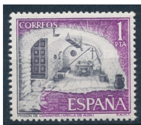
Afb. 10. De veronderstelde gevangenis cel van Cervantes in Argamasilla

Zoals in de inleiding tot deze reeks al is gememoreerd (zie Iberia 121), diende Cervantes, na het verlies van zijn linker hand in de slag bij Lepanto verder als kwartiermeester in het leger. In die hoedanigheid werd hij, vermoedelijk ten onrechte, beschuldigd van malversaties, en hij belandt enige tijd in het gevang. Tijdens die gevangenschap houdt hij zich onledig met het schrijven van toneelstukken. Weinig is nog bekend over die periode, maar de legende wil dat hij was opgesloten in de gevangenis van Argamasilla de Alba, een kleine plaats in La Mancha. Er bestaat geen enkele historische evidentie dat hij hier zijn straf uitzat; het was vermoedelijk in Sevilla. Maar Cervantes heeft deze mythe zelf in het leven geroepen, en hij wordt met graagte voortgezet door de VVV van het kleine Argamasilla. Het kantoor daarvan bevindt zich overigens in hetzelfde 16e eeuwse pand als de veronderstelde cel, die te vinden is in de grotachtige kelderruimte ervan. Ook al berust het verhaal op fictie, de 2 peseta-waarde van de Turismo -serie van 1975 toont een afbeelding van dit gestileerd cachot, en menig toerist en Quichot-fan daalde er reeds naar af.