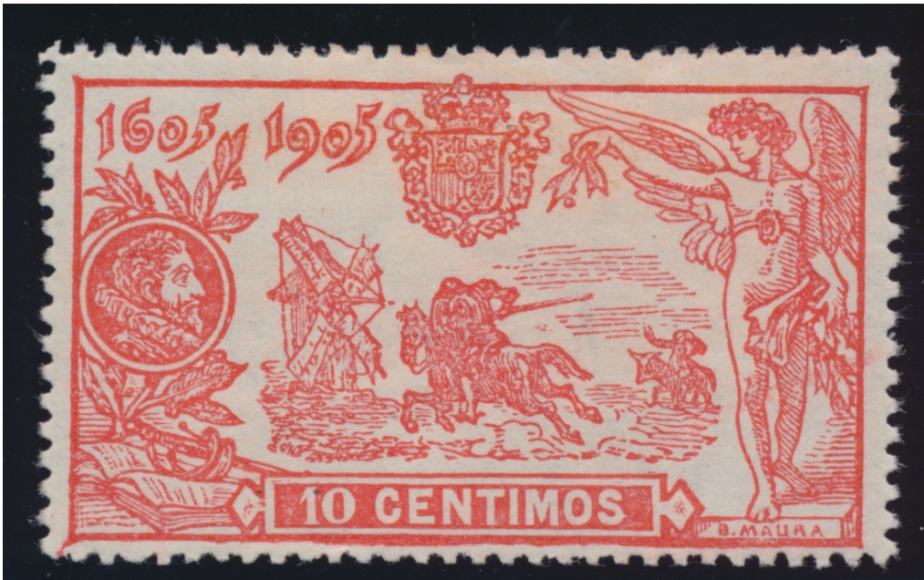
Afb. 1. Don Quichot's gevecht tegen de windmolens

Edifil nummer: Ed. 258 (zelfde nummer in Anfil en Filabo, Galvez nr. 331, Yvert 227, Michel 221, Scott 288, Stanley Gibbons 308).