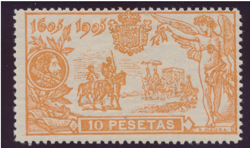
Afb. 1. Don Quichot's confrontatie met de Bask

Edifil nummer: Ed. 266 (zelfde nummer in Anfil en Filabo, Galvez nr. 339, Yvert 235, Michel 229, Scott 296, Stanley Gibbons 316).