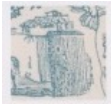
Afb. 4. Plaatfout: vlek op muur

Er is tenslotte een plaatfout bekend van de 5 céntimos, in de vorm van een vlek op de muur aan de rechterzijde. De fout bevindt zich op het zegel links boven in het tweede blok van het vel (positie 26), als te zien in afbeelding 4.