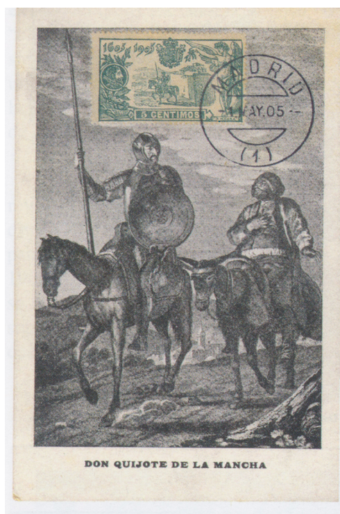
Afb. 6. Maximumkaart uit 1928 met zegel van 5 céntimos

Quichot hier vergezeld van zijn knecht Sancho, hetgeen op zijn eerste tocht nog niet het geval was. Het stempel - 5 mei 1905 – zal uiteraard vals zijn.