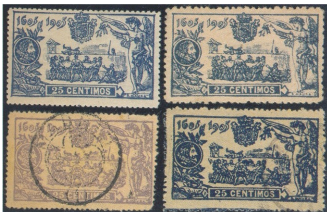
Afb. 3. Vervalsingen van de 25 céntimos; alleen links-boven is echt

bekend met velnummers A.000,007, A.000,196, A.001,965, A.003,176, A.003,195 en A.003,206. Deze nummers vallen alle binnen de reeks van de echte velnummers; de vervalste zegels kunnen daardoor dus extra bedrieglijk zijn. Afbeelding 3 toont enkele voorbeelden van vervalsingen.