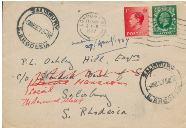
Afb. 10. Brief uit februari 1937 met mengfrankering (SG458; SG439)