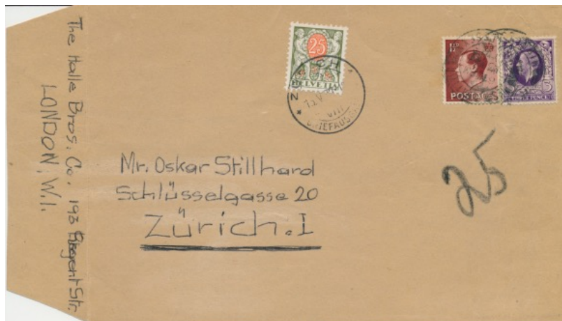
Afb. 11. Brief gedateerd 13 mei 1937 met mengfrankering (SG459; SG444)