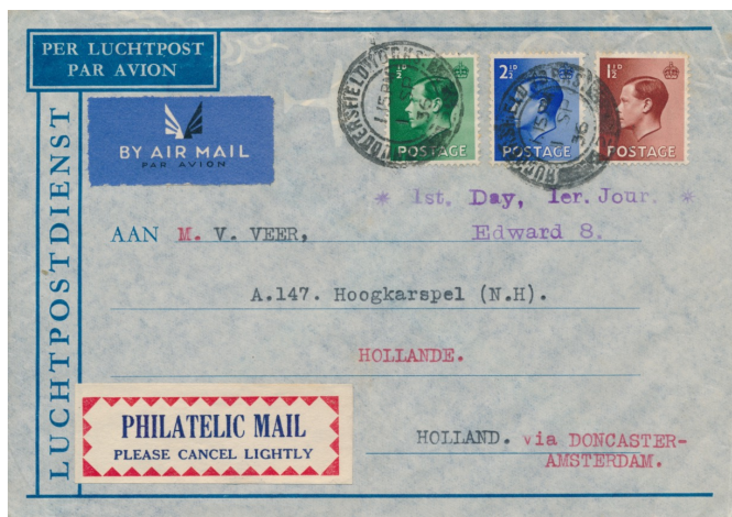
Afb. 6. FDC met de eerste drie Edward VIII zegels (SG457-458, SG460)

Het duurt vervolgens maar liefst ruim zes maanden voordat de eerste zegels met het portret van de nieuwe koning verschijnen. Op 1 september zien eindelijk drie waarden het licht: ½d, 1½d en 2½d, in wel het meest sobere ontwerp van alle permanente uitgiften tot dan toe. In tegenstelling tot vele eerdere uitgiften ontbreekt ook het woord 'Revenue': er staat slechts 'Postage' op het zegel. Een First Day Cover met deze zegels vindt men in afbeelding 6. Deze brief is verstuurd vanuit Huddersfield, is eerst via het nabij gelegen vliegveld Doncaster naar Amsterdam getransporteerd, en vandaar naar eindbestemming Hoogkarspel (N.H.). Opmerkelijk is dat gebruik is gemaakt van een Nederlandse luchtpostenvelop; mogelijk was het de geadresseerde zelf die hem stuurde. Of de postbeambte in kwestie aan het vriendelijke verzoek om lichte afstempeling heeft voldaan daarover kan men twisten.