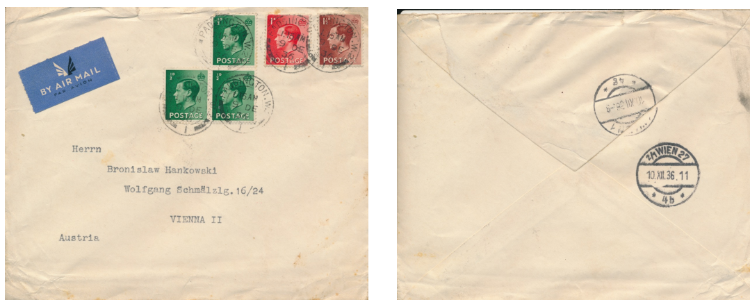
Afb. 8. Luchtpostbrief met de drie laagste waarden (SG457-459)

Drie van deze vier zegels voldoen, net als bij de langlopende series met het portret van George V, aan het kleurenschema als vastgesteld door de U.P.U.: een lage waarde in groen (bedoeld voor een briefkaart), een hogere in rood (voor een binnenlandse brief), en een hoogste in blauw (voor internationale post). Deze zegels worden dan het alledaagse frankeermiddel. Dat blijft in elk geval zo tot aan 10 december 1936, de dag waarop Edward zijn aftreden bekend maakt in een dramatische radio-toespraak. Afbeelding 8 toont een luchtpostbrief die verstuurd werd vanuit Paddington, Londen op de voorlaatste dag van Edward's koningschap. De brief kwam aan in Wenen op de dag van de officiële abdicatie, 11 december.