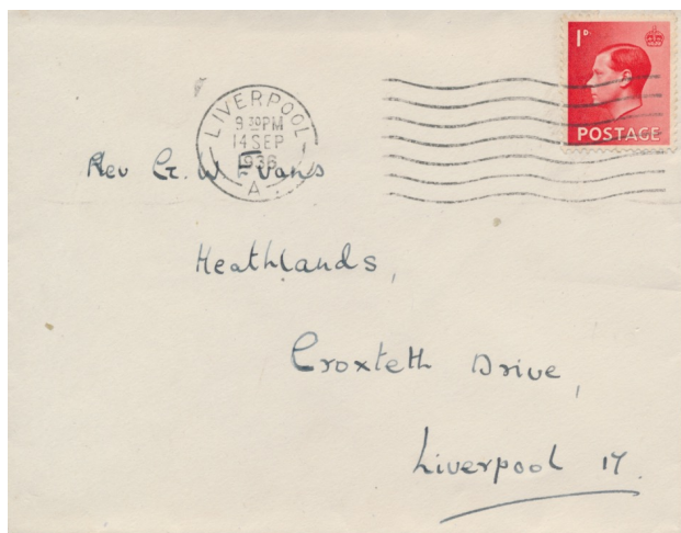
Afb. 7. Aanvullende 1d waarde Edward VIII (SG459)

Drie van deze vier zegels voldoen, net als bij de langlopende series met het portret van George V, aan het kleurenschema als vastgesteld door de U.P.U.: een lage waarde in groen (bedoeld voor een briefkaart), een hogere in rood (voor een binnenlandse brief), en een hoogste in blauw (voor internationale post). Deze zegels worden dan het alledaagse frankeermiddel. Dat blijft in elk geval zo tot aan 10 december 1936, de dag waarop Edward zijn aftreden bekend maakt in een dramatische radio-toespraak. Afbeelding 8 toont een luchtpostbrief die verstuurd werd vanuit Paddington, Londen op de voorlaatste dag van Edward's koningschap. De brief kwam aan in Wenen op de dag van de officiële abdicatie, 11 december.