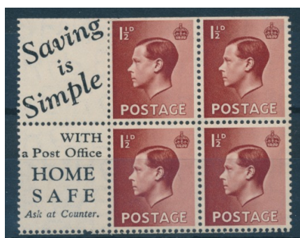
Afb. 12. Inhoud van postzegelboekje met viermaal SG459

van de inhoud van een Edwardiaans postzegelboekje vindt men in afbeelding 12.