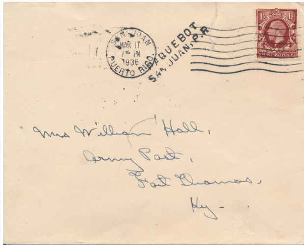
Afb. 5. Brief van 17 maart 1936 met SG441

Het duurt vervolgens maar liefst ruim zes maanden voordat de eerste zegels met het portret van de nieuwe koning verschijnen. Op 1 september zien eindelijk drie waarden het licht: ½d, 1½d en 2½d, in wel het meest sobere ontwerp van alle permanente uitgiften tot dan toe. In tegenstelling tot vele eerdere uitgiften ontbreekt ook het woord 'Revenue': er staat slechts 'Postage' op het zegel. Een First Day Cover met deze zegels vindt men in afbeelding 6. Deze brief is verstuurd vanuit Huddersfield, is eerst via het nabij gelegen vliegveld Doncaster naar Amsterdam getransporteerd, en vandaar naar eindbestemming Hoogkarspel (N.H.). Opmerkelijk is dat gebruik is gemaakt van een Nederlandse luchtpostenvelop; mogelijk was het de geadresseerde zelf die hem stuurde. Of de postbeambte in kwestie aan het vriendelijke verzoek om lichte afstempeling heeft voldaan daarover kan men twisten.