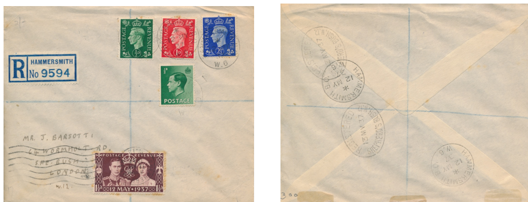
Afb. 14. FDC van 13 mei 1937 (SG 457, SG 461, SG462-463, SG466)

Een wat meer orthodoxe FDC met hetzelfde kroningszegel is te zien in afbeelding 15. Dit is een aangetekend luchtpoststuk, gestuurd op 13 mei 1937 vanuit Gosport, een plaatsje vlak bij Portsmouth aan de Engelse zuidkust, en gericht aan een sergeant in het Britse militaire hoofdkwartier in Cairo. Het verschuldigde bedrag is aangevuld met een blokje van vier zegels van 2½d van de Edward-serie, leidend tot een mengfrankering. Mogelijk waren die dag op het postkantoor in Gosford nog geen exemplaren van de George 2½d zegels beschikbaar, ofwel men had de opdracht eerst de oude voorraden op te maken.[6] Na aankomst in Cairo op 17 mei 1937 is de brief aan de achterzijde afgestempeld op het M(ilitary) P(ost) O(ffice) aldaar. Het valt op dat in dit stempel de maand mei is afgekort tot MA, terwijl dat in stempels binnen Groot Brittannië zelf MY is. Die zelfde afkorting MA komt overigens ook voor in het stempel met Arabische tekst, dat een uur eerder op de achterzijde is geplaatst.