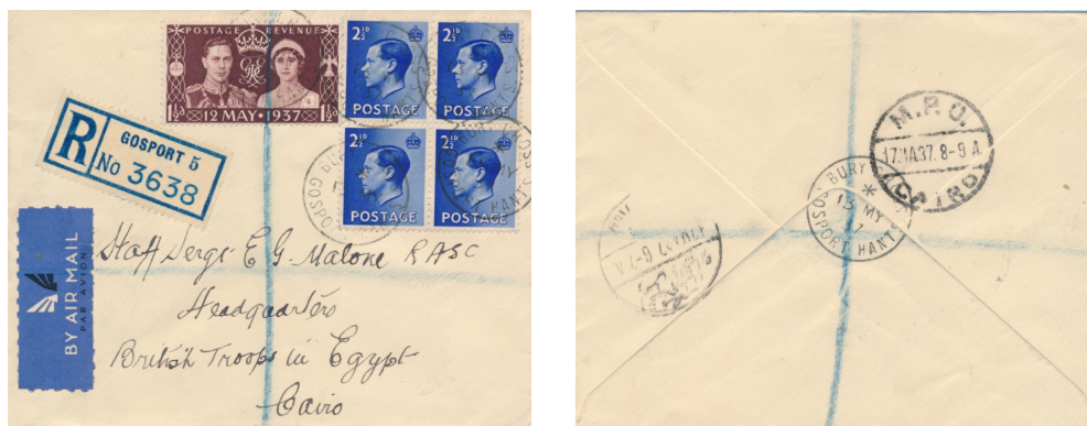
Afb. 15. FDC van 13 mei 1937 (SG457, en viermaal SG460)