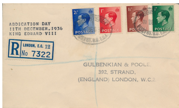
Afb. 9. Aangetekende brief op de dag van Edward's aftreden (SG457-460)

blauwe potloodkruis is er, als gebruikelijk, na de afstempeling opgezet als extra indicatie van aantekening, naast het strookje. Een snel rondje langs de internetveilingen maakte mij duidelijk dat op diezelfde dag een zeker aantal verder identieke stukken moet zijn verstuurd vanuit diverse Londense postkantoren. Dus de heren Gulbenkian en Poole, die deze brieven zonder twijfel aan zichzelf hebben gestuurd of laten sturen, zullen door snel te handelen waarschijnlijk het nodige hebben verdiend aan Edward's onverwachte besluit om er de brui aan te geven. Het bestemmingsadres bevindt zich overigens vlak bij de huidige vestiging van Stanley Gibbons.