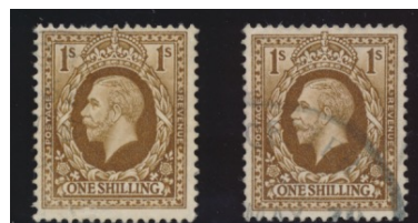
Afb. 4. Brief van 6 februari 1936 met SG429 en SG444; ernaast SG449

Afbeelding 5 toont een andere brief-na-dato met een zegel van George V. Dit stuk werd gepost aan boord van een Brits schip, op weg naar San Juan (Puerto Rico), en daar afgestempeld op 17 maart 1936. Vandaar ging de brief verder naar het legerkamp Fort Thomas, bij Cincinnati in Kentucky (U.S.A.). Deze zegels waren uiteraard de enig beschikbare, ook op het boordpostkantoor van Britse oceaanstomers.