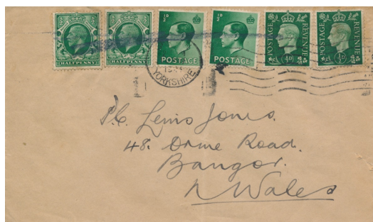
Afb. 17. Brief uit 1941 met de drie koningen (SG439, SG457, SG462)

in zwang gebleven bij de Britse postbeambten, alhoewel nu bij voorkeur een balpen wordt gebruikt als wapen.