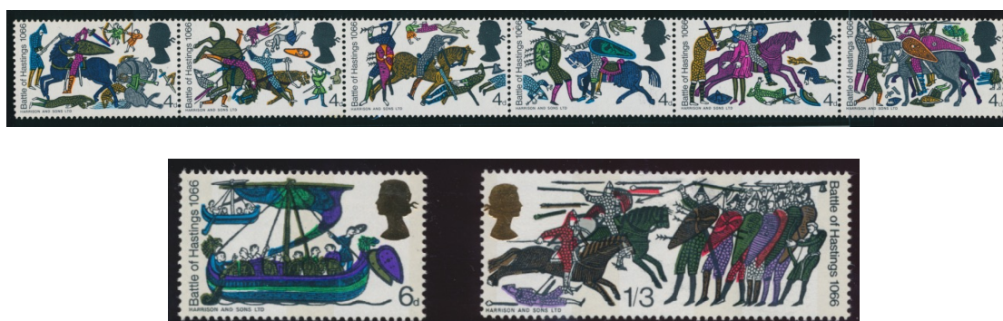
Afb. 1. Battle of Hastings (SG705-710; SG711-712)

zegels van de bewuste serie zijn te vinden in afbeelding 1. Zes zegels van 4d zijn se tenant gedrukt, daarmee het formaat van het origineel oproepende. Ze verbeelden scènes van het slagveld. Verder toont een zegel van 6d het schip waarmee William het kanaal overstak. En een zegel van 1s3d laat de twee legers tegenover elkaar zien, links de ruiters van William, rechts het voetvolk van Harold. De zegels van deze serie vertonen een aantal vrij frequent voorkomende fouten, veelal in de vorm van een verschuiving of weglating van een van de kleuren. Het hier afgebeelde exemplaar van 1s3d kent een verschuiving van de kleur rood, onder meer zichtbaar aan de knots die richting het hoofd van de voorste ridder wordt geworpen. De strip van zes is hier verkleind afgedrukt; deze zes zegels hebben in werkelijkheid hetzelfde formaat als het zegel van 6p.