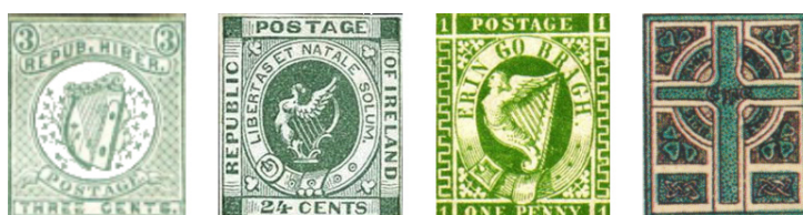
Afbeelding 4. Home Rule propaganda labels

De Britse zegels, met respectievelijk Queen Victoria, King Edward VII en King George V, waren de gangbare frankeerwaarden in geheel Ierland. Maar er was, vanaf de inlijving in het Britse rijk in 1801, een toenemende roep om Home Rule – zelfbeschikking – met name in het overwegend katholieke zuiden van het land. Dit kwam tot uiting in een aantal niet-officiële uitgiften, afbeelding 4, die als propagandazegels moeten worden gezien, niet geaccepteerd voor frankering. Gespecialiseerde catalogi nemen ze echter wel op, soms met forse catalogusprijzen.