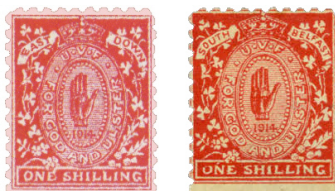
Afbeelding 5. Anti Home Rule propaganda-labels uit Belfast (1914)

Ook het overwegend protestantse noorden roerde zich, met Anti Home Rule uitgiften, weer zonder enige frankeerwaarde, waarvan twee voorbeelden getoond worden in afbeelding 5.