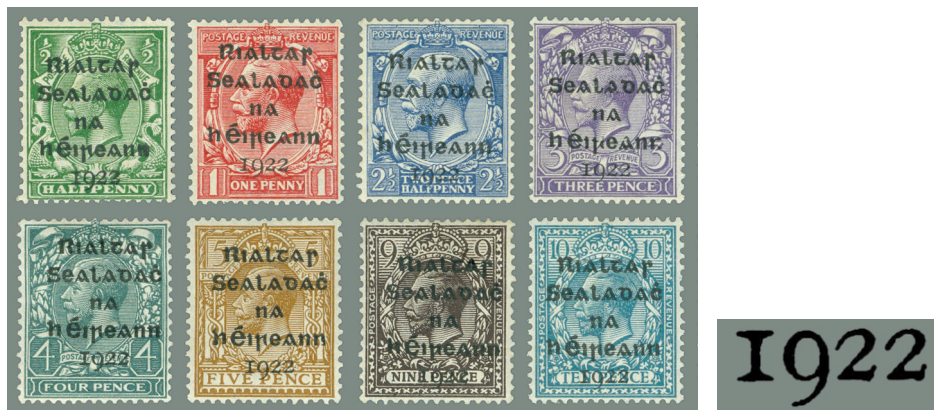
Afbeelding 7. De Dollard overdrukken van februari 1922

Dollard bracht de overdruk aan op acht waarden (½d, 1d, 2½d, 3d, 4d, 5d, 9d en 10d; catalogus nrs. T1-8, SET 1T, afbeelding 7), terwijl Thom de andere vier waarden (1½d, 2d, 6d en 1s; T15-19; SET 4T, afbeelding 11 verderop) voor zijn rekening nam. 1 In beide gevallen werd gebruik gemaakt van het Keltische alfabet, en zwarte inkt. De zegels werden op 17 februari 1922 beschikbaar gesteld.