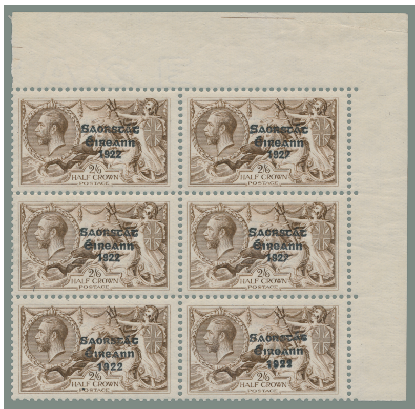
Afbeelding 29a. Verticale paren 2s 6d (N-W)