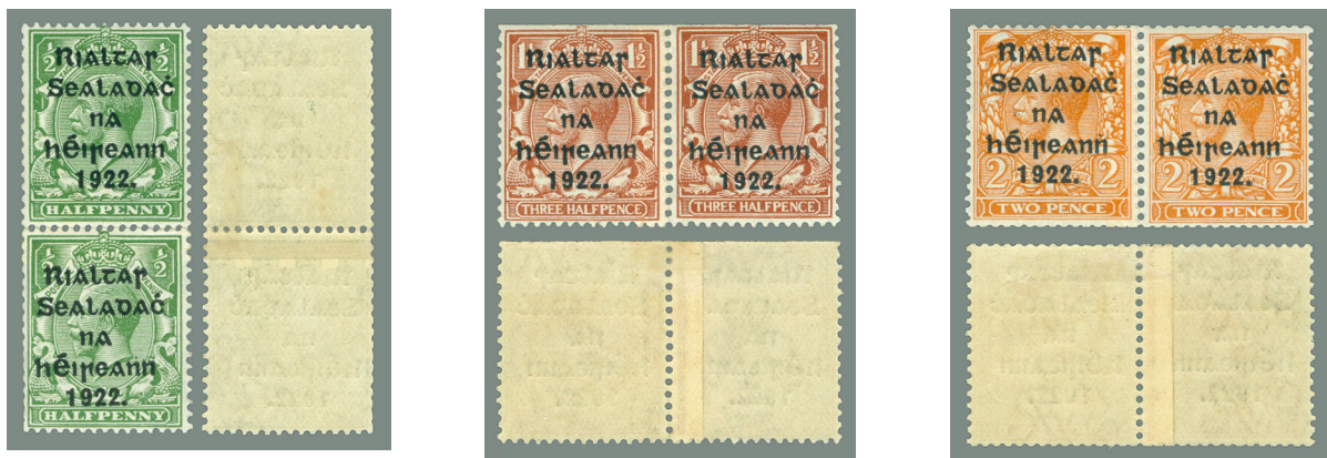
Afb. 13a, L > R: T20 verticale, T22 en T24 (Die II) horizontale rolzegels, alle met lasnaad

Weer enkele maanden later ontstond behoefte aan zegels voor postzegelautomaten. Omdat men ervan uitging dat de Ierse drukkers hiervoor niet waren toegerust werd de Londense firma Harrison & Sons Ltd. (Harrison) ingeschakeld. Deze leverde op 19 juni rollen van de vier laagste waarden af, die zich met name onderscheiden van de Ierse versies door een glimmend-zwarte opdruk, en de meestal nogal korte parallel-perforaties, zoals gebruikelijk bij horizontale en verticale automaatzegels. Zie T20-24 in de afbeelding 13a en 13b.