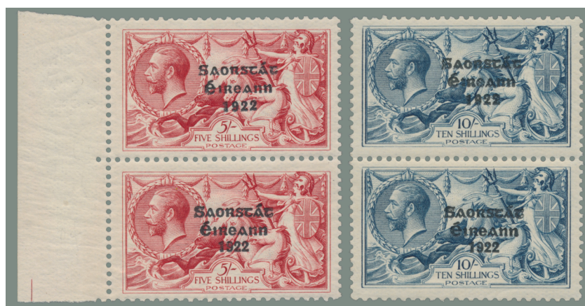
Afbeelding 29b. Verticale paren 5s en 10s (W-N)

Alle vier mogelijke de combinaties – N–W en W–N horizontaal en verticaal – komen voor bij alle drie zegelwaarden.