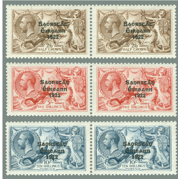
Afbeelding 28. Horizontale paren (W-N)

Er bestaan verticale en horizontale paren met een combinatie van de brede (W – wide) en minder brede (N – narrow) opdrukken (T69v-T71v en T69h-T71h). Dit is een gevolg van het feit dat een deel van de clichés, die bij de augustus 1925 uitgifte allemaal ‘narrow’ waren, in 1927 werden gecorrigeerd, waarbij ze wijder uitvielen. In afbeelding 28 zijn de horizontale paren (T69h-T71h) weergegeven met het brede jaartal op de linker zegel en het minder brede jaartal op de rechter.