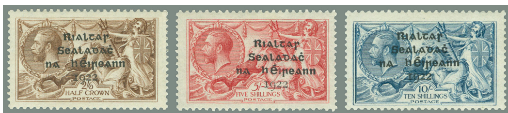
Afbeelding 10. De 'Seahorses'

Dollard kreeg het contract om de hoge waarden te overdrukken. Hiertoe werden alleen de 2s 6d, de 5s en de 10s waarden van de fameuze 'Seahorses' geselecteerd. Aan het groene pondzegel bestond kennelijk geen behoefte. Dankzij de grotere breedte van de zegels kon hier worden volstaan met een 4-regelige opdruk, afbeelding 10. Ze verschenen eveneens op 17 februari aan de loketten (T12-14).