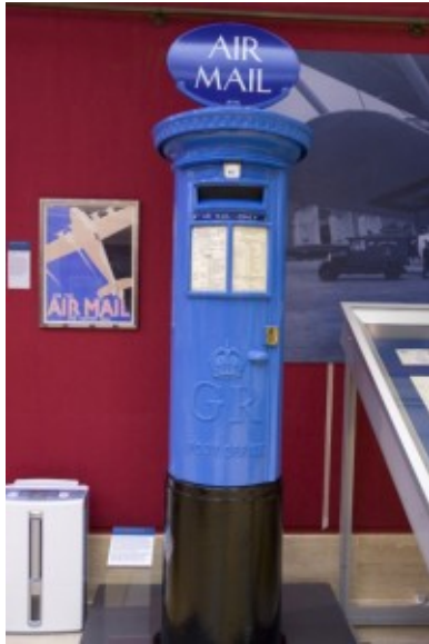
Afb. 5. Een speciale luchtpostbus

Het bleef echter ook na 1859 niet bij het standaard model. Sommige Postmasters van kleine kantoren vonden de originele brievenbussen te groot. Rond 1885 lieten sommige van hen kleinere bussen ontwerpen. Die waren vaak grotendeels van hout, met alleen een ijzeren voorkant, en konden in een muur worden geplaatst. Naar een van eerste uitvoerders ervan heten deze brievenbussen de Ludlow Box. Ze bleven in productie tot 1965. Afbeelding 6 toont een vroeg en een laat voorbeeld.