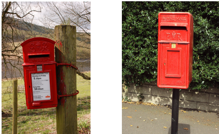
Afb. 7. De Lamp Box

Omstreeks 1896 werd een alternatief gevonden voor de Ludlow bus op die plaatsen waar inbouwen niet de beste oplossing was. Dit werd de zgn. Lamp Box, die eenvoudigweg werd gemonteerd op een lantaarn- of andere paal. Ook hiervan werden meerdere typen ontworpen en geïntroduceerd. Dit is de kleinste soort brievenbus, die ongeveer 40 jaar in productie is geweest, maar nog op allerlei plaatsen in Groot Brittannië te vinden is. Afbeelding 7 toont twee exemplaren.