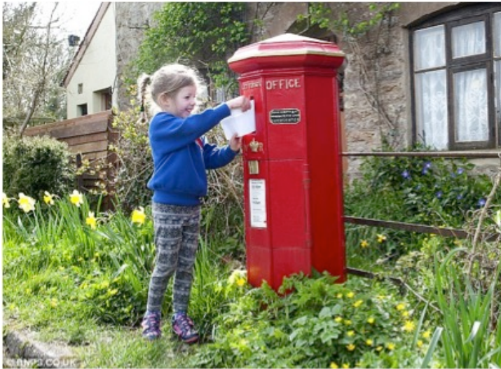
Afb. 3. De alleroudste bus, in Holwell (Dorset)