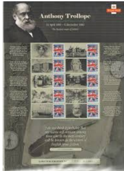
Afb. 12. Het Trollope-velletje (2015)

Op SG3129 en SG3132 (Christmas, 2010) staan weer min of meer ‘toevallige’ brievenbussen. Tenslotte is op 24 April van dit jaar een velletje verschenen ter ere van de 200-ste geboortedag van Anthony Trollope, de man van de allereerste Britse brievenbus.