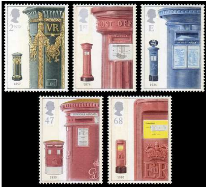
Afb. 10. Ter gelegenheid van de 150-ste verjaardig van de Pillar Box (2002)

Zeven jaar later wordt de verzamelaar verblijd met een serie van vier zegels in postzegelboekje DX46 en velletje MS2954, alle met de afbeelding van een Wall Box. We zien in afbeelding 11, van links naar rechts, een bus uit 1933; een type Ludlow uit de periode van Edward VII; een Victoriaanse Lamp Box uit 1896; en een moderne muurbus uit 1962.