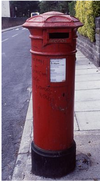
Afb. 1. First National Standard Letter Box

Voordat op 6 mei 1840 de voorfranking van de post middels de postzegel werd ingevoerd in het Verenigd Koninkrijk, was het gebruikelijk post af te leveren bij een postkantoor, of bij een andere stopplaats van de postkoets. Deze praktijk werd ook na het verschijnen van de Penny Black voortgezet. Gaandeweg bleek dat dit op plaatsen waar postkantoren dun gezaaid waren tot grote bezwaren leidden. Immers, men kon wel bij een bezoek meerdere zegels aanschaffen, maar moest nog steeds voor elke te verzenden brief of kaart naar het postkantoor. De klachten kwamen terecht op het bureau van de Postmaster - tevens uitvinder van de postzegel - Rowland Hill. In 1852 besloot hij een inspecteur aan te stellen die het probleem zou moeten oplossen. Hij deed een beroep op de schrijver Anthony Trollope (1815-1882), die in zijn jonge jaren reeds zijn sporen had verdient als beambte bij de General Post Office, en wel in Ierland, dat in die tijd nog onder Britse hegemonie was. Trollope vertrok spoorwegs naar de Kanaaleilanden, waar de situatie het meest nijpende was, mede als gevolg van het onregelmatige bootverkeer. Trollope was vermoedelijk op de hoogte van het feit dat men om soortgelijke redenen in Frankrijk overgegaan was tot het plaatsen van 'letter-receiving pillars' langs de openbare weg. Hij gaf dan ook de ijzergieterij Vaudin & Son te Jersey opdracht om vier van dergelijke 'pillars' te fabriceren.