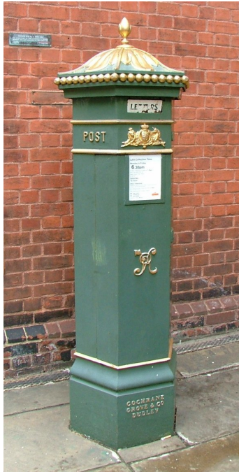
Afb. 4. Bus van het type Penfold (Rochester)

De aanvankelijke wildgroei aan types gaf al snel aanleiding tot opmerkingen en klachten van het publiek over de vorm, de kleur, de plaatsing en oriëntatie van de gleuf, de belettering, enzovoorts. Dit leidde in 1859 tot de invoering van een gestandaardiseerd ontwerp, dat hierboven is afgebeeld (afb. 1). Als standaardkleur werd gekozen voor groen. Men achtte dit de meest onopvallende, met de omgeving harmoniserende kleur, met name voor locaties op het platteland. Te onopvallend, bleek gaandeweg, want het gebeurde herhaaldelijk dat mensen tegen een brievenbus aan liepen. Daarom werd in 1873 bepaald dat alle bussen voortaan rood dienden te zijn. Het duurde echter zo'n jaar of tien voordat alle inmiddels duizenden exemplaren in die kleur waren overgeschilderd. Overigens werd in de dertiger jaren van de twintigste eeuw enige tijd geëxperimenteerd met blauwe bussen die speciaal waren bedoeld voor de luchtpost, die toen enorm in opkomst was. Maar ook deze werden in 1938 rood geschilderd.