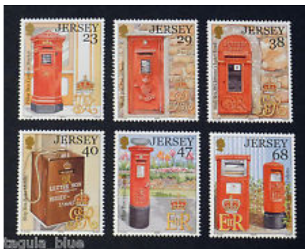
Afb. 14. Brievenbusserie van Jersey (2002)

Uiteraard lieten ook de Kanaaleilanden zich, als de eerste plaatsen waar brievenbussen hun opwachting maakten, niet onbetuigd. Afbeelding 14 toont een serie van Jersey uit het jubileumjaar 2002, en afbeelding 15 een zegel-in-blokvorm van Guernsey uit hetzelfde jaar.