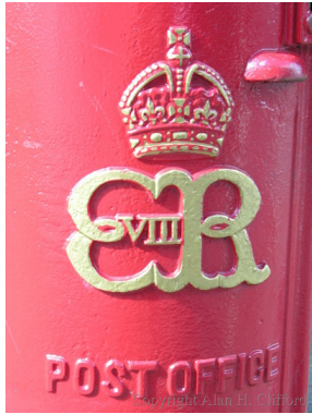
Afb. 8. Brievenbus uit de tijd van Edward VIII (detail)

Het kon natuurlijk niet uitblijven, in het land van de hobbyclubs: er is, sinds 1976, een Letter Box Study Group. Die heeft, volgens de eigen website, als doel (ik laat het onvertaald) 'to encourage research, preservation, restoration and awareness of letter boxes and the definitive description and documentation of their types and locations'. De club heeft inmiddels ongeveer 600 leden, in binnen- en buitenland. Men werkt aan de voltooiing van een gids, de Guide to British Letter Boxes, waarin inmiddels ruim 100.000 van de naar schatting 116.000 nog bestaande brievenbussen worden beschreven. Volgens deze gezaghebbende bron zijn er in totaal zo'n 700 typen brievenbus in Groot Brittannië. Daaronder zijn ruim 380 typen Pillar Box, 80 typen Ludlow Box, 80 typen Lamp Box, en 60 typen Wall Box. Maar men vindt dergelijke brievenbussen niet alleen in het Verenigd Koninkrijk en op de Kanaaleilanden. Het ontwerp is ook geëxporteerd naar een aantal (voormalige) koloniën (o.m. Gibraltar, Cyprus, India, Australië en Nieuw Zeeland); naar landen waar de Britten ooit de postdienst verzorgden (Koeweit, Marokko); en naar enkele andere landen, waar de Britse invloed aanzienlijk was (Portugal, Argentinië, Uruguay).