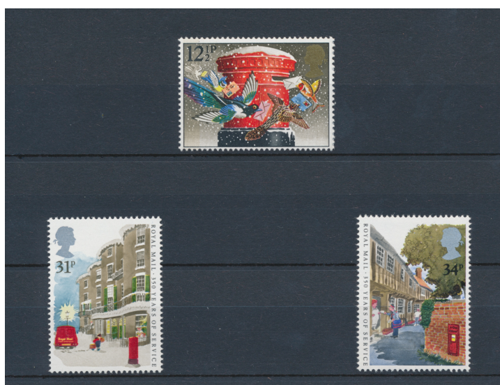
Afb. 9. De eerste Britse zegels met een brievenbus

Maar wenden wij ons tenslotte tot de filatelie zelf. Bij mijn weten heeft het tot 1983 geduurd – dus 130 jaar na zijn introductie – tot Royal Mail uitkwam met een postzegel met daarop de afbeelding van een brievenbus. Het is een kerstzegel, met Stanley Gibbons nummer 1231, en als thema 'Christmas Post'. De overige vier zegels uit dezelfde serie tonen andere kerstsymbolen. Twee jaar later verschijnt er een hele serie gewijd aan het 350-jarig bestaan van Royal Mail zelf. Twee van de vier zegels van deze serie, met SG-nummers 1292 en 1293, tonen een brievenbus, zij het min of meer zijdelings. Zie afbeelding 9.