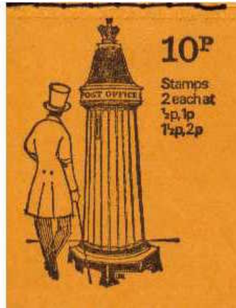
Afb. 13. Een boekje uit de serie British Pillar Boxes (1971-74)

Latere boekjes, met name nummers KX3 (1991), KX5 (1992), KX6 (1993) en LX32 (2006), hebben ook een afbeelding van een brievenbus op het kaft.