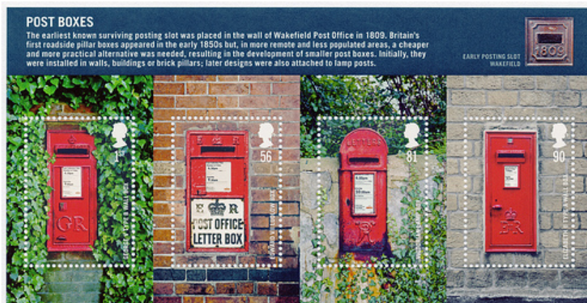
Afb. 11. Brievenbussen van het muurtype (2009)

Zeven jaar later wordt de verzamelaar verblijd met een serie van vier zegels in postzegelboekje DX46 en velletje MS2954, alle met de afbeelding van een Wall Box. We zien in afbeelding 11, van links naar rechts, een bus uit 1933; een type Ludlow uit de periode van Edward VII; een Victoriaanse Lamp Box uit 1896; en een moderne muurbus uit 1962.