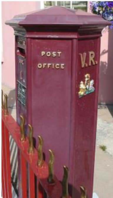
Afb. 2. Het eerste type brievenbus (Guernsey)

Op 23 November 1852 werden deze geplaatst op vier strategische punten in Saint Helier, de hoofdstad van Jersey. Enkele maanden later werden er nog eens drie geplaatst op het nabijgelegen eiland Guernsey. Deze brievenbussen waren overigens noch rond noch rood, zoals te zien is in afbeelding 2. Dit betreft een nog functionerend exemplaar van het oorspronkelijke type, te vinden op Guernsey.