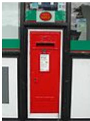
Afb. 6. Een vroege en een late Ludlow Box