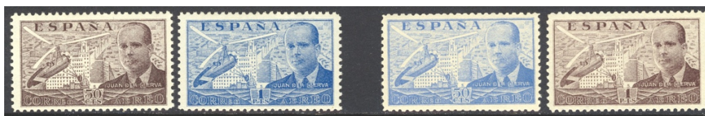
Afb. 43 De la Cierva I (1939) Ed.883/884 en Ed.883/884cc

Bij de ongetande proeven ging het om aanmerkelijk geringere kleurverschillen: de 20 céntimos werd oranje , niet oker , en de 4 peseta's grijsblauw , niet ultramarijn .