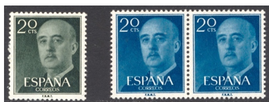
Afb. 55 Franco V (1955) Ed.1145/cc

Een laatste stuip trekking van de cc zijn enkele waarden van de wederom vernieuwde Franco-serie uit 1955. Van deze inmiddels vijfde Franco-versie in zestien jaar bestaan de nodige ' variedades de color ' ('kleurvariaties'), op dof en glimmend papier. Die zijn alle op het postkantoor te koop geweest. Slechts van drie waarden zijn er heuse kleurproeven bekend: van de 20 céntimos, en de 1 en 5 peseta's. Van de eerste waarde treft men een paartje in de kleur blauw aan in afbeelding 55. Uiteindelijk werd gekozen voor bronsgroen .