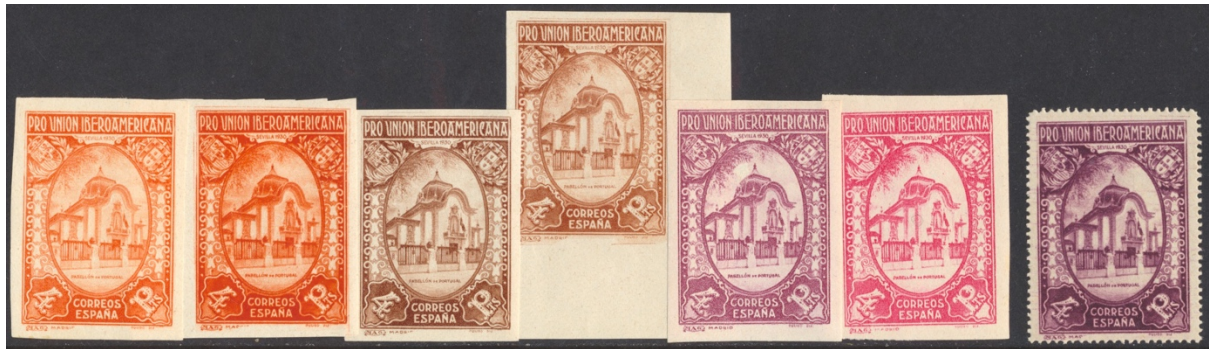
Afb. 18 Pro Unión (1930) Ed.579ccs/ccas/ccbs/cccs/ccds/cces, 579

Maar de kroon spant de hoogste waarde van de serie. Zoals vermoedelijk bekend werd de 10 peseta's in twee drukvormen geproduceerd: een versie in koperdiepdruk (' hucograbado '; Ed.580) en een gegraveerde versie (' calcografía '; Ed.581). Van de eerste soort bestaan vier ongetande kleurproeven, van de tweede niet minder dan elf. Dat is waarschijnlijk het recordaantal cc voor een enkele zegel.