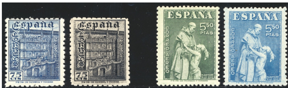
Afb. 51 Fiesta de la Hispanidad (1946) Ed.1003/f, 1004f(?)

Direct hierna kwam er een serie uit in het kader van de Fiesta de la Hispanidad , bestaande uit drie zegels. Van alle exemplaren zijn cc bekend: drie voor de 50 céntimos, en een voor de 75 céntimos en de 5,50 peseta's. Daarnaast zijn er kleurvarianten bekend geworden die door de Edifil worden geboekstaafd als ' fantasías '. Er zijn er in diverse kleuren voor de 75 céntimos, zoals het zwarte exemplaar links in afbeelding 51. Een blauwe uitvoering van de 5,50 peseta's wordt niet gemeld, maar ik neem aan dat dit zegel ook de code 1004f zou moeten krijgen. [13]