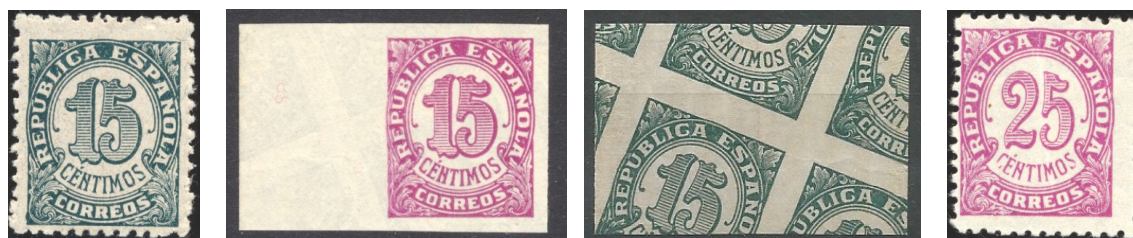
Afb. 32 Cifras (1938) Ed.747, 747ccs/s, 749

Aan de kant van de Republiek verschijnen de eerste twee jaar van de oorlog bijzonder weinig zegels. Na wat overdrukken op bestaande zegels met oog op het gestegen brieftarief is de eerste echte uitgifte de cijferserie van april 1938, een ontwerp waarin reeds twee lage waarden waren verschenen in 1933. Van deze uit zes zegels bestaande serie zijn twee cc en een ccs bekend. In afbeelding 32 staat het alternatief voor de zegel van 15 céntimos. De proefuitvoering is in rozellila , de kleur die uiteindelijk terecht kwam bij de 25 céntimos. Dat het om een echte proef gaat blijkt als we naar de achterzijde kijken: hiervoor is een vel gebruikt waarop ook de uiteindelijke kleur was uitgetoet. En dat was het wat minder in het oog lopende grijsgroen .