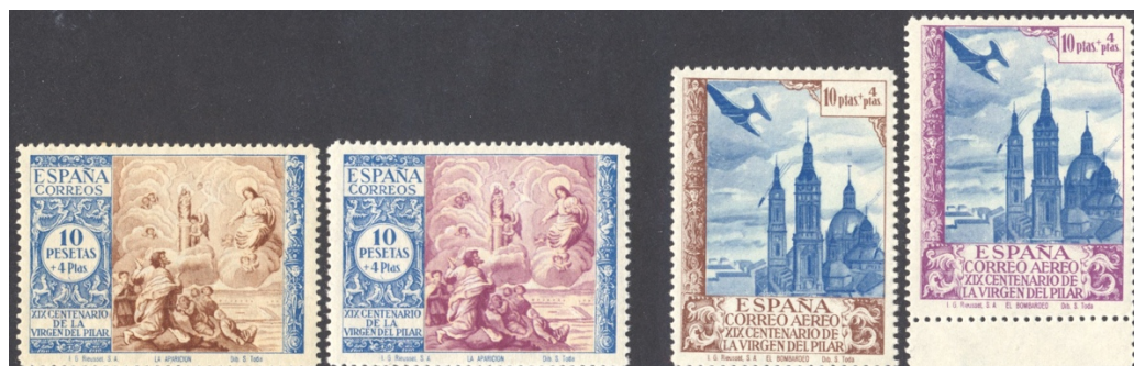
Afb. 48 Virgen del Pilar (1940) Ed.902/cc en Ed.913/cc

bruin met een blauw kader, die voor de luchtpost is blauw met een bruin kader. Bij de kleurproeven heeft paars het bruin vervangen.