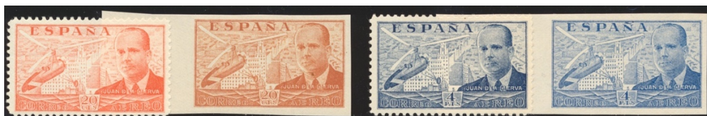
Afb. 44 De la Cierva I (1939) Ed.880/ccs en Ed.886/ccs

Bij de ongetande proeven ging het om aanmerkelijk geringere kleurverschillen: de 20 céntimos werd oranje , niet oker , en de 4 peseta's grijsblauw , niet ultramarijn .