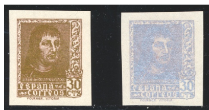
Afb. 40 Fernando el Católico (1938) goud- en zilverkleurig Ed.844Acc/cca

De catalogus vermeldt voorts dat er ook nog diverse andere nuances voorkomen van met name groen en karmijn dan de hier getoonde. Men vond het zelfs nodig om exemplaren uit te proberen in goud- en zilverkleurige uitvoering. Een dramatisch contrast met de zegels die tegelijkertijd in Republikeins gebied werden voorbereid, en de tekorten waar men daar mee te kampen had. Kennelijk kon het allemaal niet op bij drukkerij Fournier in Vitoria. In ieder geval is het bij de scans in afbeelding 40 niet allemaal goud wat er blinkt.