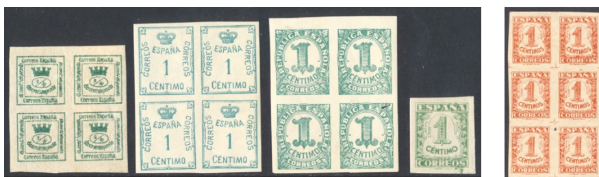
Afb. 35 Cifras (1936) Ed.173/291/677/802, 802cca

Naast de getande roodbruine 2 céntimos cijferzegel verscheen een ongetande 1 céntimo, in de kleur groen . Daarbij werd kennelijk teruggegrepen op een oude traditie. In 1873, acht jaar na de invoering van de perforatie, werden er groene zegeltjes van ¼ peseta ongetand uitgegeven, en typisch in blokjes van twee bij twee à 1 peseta verkocht.[10] Tandeloos bleven eveneens de groene 1 céntimo zegels uit 1920 en 1933. Waarom men hier was teruggekeerd tot uitknippen in plaats van uitscheuren is mij niet geheel duidelijk. Wellicht werden deze zegels gewoonlijk in grotere gehelen gekocht en ook opgeplakt. De duidelijk op zijn Republikeinse voorganger geënte 1 céntimo zegel van de Junta was dan ook groen , maar kende toch een proef in de kleur van de 2 céntimos, te weten roodbruin . Alle genoemde zegels staan in afbeelding 35.