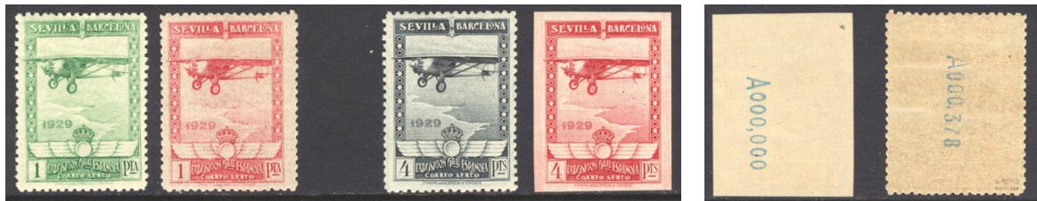
Afb. 9 Aéreo (1929) Ed.452/cc en 453/ccs plus achterzijden

A000,000. Het roze proefexemplaar van de 1 peseta heeft weer een - opmerkelijk - hoog rugnummer, dat ergens in de uitgegeven serie past.