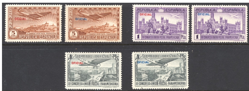
Afb. 25 III Congreso Postal Aéreo (1931) Ed.630/hcc, 634/hcc, 635/hcc

Deze serie laat ook een voorbeeld zien van hcc, de 'cambio de color en la habilitacion' ('kleurverandering in de opdruk'). Aanvankelijk heeft men kennelijk overwogen alle opdrukken in blauw aan te brengen, afgezien dan van de zegel van 50 céntimos, die zelf blauw is. Bij nader inzien werd het toch ook rood voor de drie waarden in afbeelding 25, ik neem aan omdat deze kleur beter bleek te contrasteren met de eigen kleur van deze zegels.