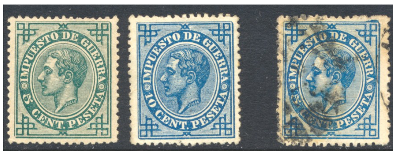
Afb. 5 Impuesto de Guerra (1876) Ed.183, 184, 183ec.

Het gaat hier dus niet om proeven, bewust vervaardigd om tot een juiste kleurkeuze te kunnen komen, maar om heuse drukfouten, die tot de meer kostbare stukken van de Spaanse filatelie behoren. Ze zijn onbedoeld in de verkoop gekomen, en soms zelfs uitsluitend afgestempeld bekend geworden, zoals het exemplaar in afbeelding 4. Het type 'ec' is daarom normaliter getand. Vermoedelijk als gevolg van verbeterde druktechnieken komt deze drukfout gaandeweg steeds minder voor. Een van de meer recente exemplaren die ik ken is een zegel uit de Vaquer -serie van 1930, getoond in afbeelding 6. De voor de 40 céntimos gekozen kleur is blauw , de door de UPU voorgeschreven kleur, en niet lichtbruin .