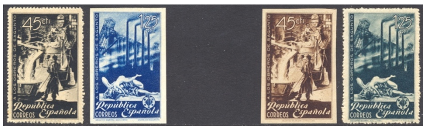
Afb. 33 Homenaje a los obreros de Sagunto (1938) Ed.773/744s, 773ccs/774cc

Van de allerlaatste nog tot uitgifte gekomen serie van de Republiek, opgedragen aan de Milicias ('Volksmilities'), zijn er kleurproeven van twee van de negen waarden: een van de 10 céntimos en drie van de 25 céntimos.