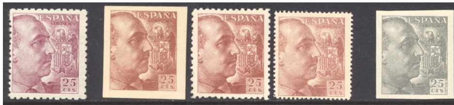
Afb. 47 Franco y Escudo II (1939) Ed.923/ccs/cc/ccd/ccsa

Een tweede uitgifte op basis van dit ontwerp zag het licht in december van datzelfde jaar. Dit zou nog vijf jaar lang de permanente zegel blijven. De tweede versie behield enkele waarden in dezelfde kleur, zag verandering daarin bij andere waarden, en kreeg er drie lage waarden bij. De catalogus vermeldt cc voor drie waarden ervan – de 25 en 50 céntimos en de 10 peseta's. De 25 céntimos werd uitgevoerd in de kleur karmijnlila . Er zijn twee kleurproeven van deze waarde: roodbruin en parelgrijs . Van de roodbruine variant kennen we een ongetande versie, een in de gebruikte tanding 9\frac{1}{2} bij 10\frac{1}{4} en een in de fijnere proeftanding 14. Er is dus aardig mee geëxperimenteerd.