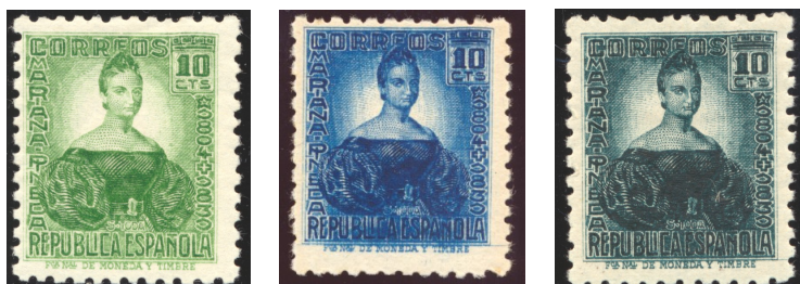
Afb. 31 Españoles ilustres II en III: Mariana Pineda (1936) Ed.682/cc, 732

Ook de Pineda-zegel kent zo zijn varianten. Van het uiteindelijk uitgebrachte exemplaar bestaan er, naast de hoofdkleur groen , ook nog versies in geelgroen en lichtgroen . Daarnaast zijn er echter ook proeven bekend geworden in de kleuren donkerblauw , bruin en rood . Die blijken lastig te vinden te zijn, met name de laatste twee. Kennelijk zijn ze tamelijk recent opgedoken, want de Edifil Especializado van 2004 vermeldt er geen. In afbeelding 31 staat links het groene definitieve exemplaar, met ernaast de proef in donkerblauw . In 1936 verschijnt een identieke zegel, maar nu uitgevoerd in blauwgroen . Het tarief voor drukwerk bedroeg inmiddels 15 céntimos, zodat de Concepción Arenal-zegel met die waarde de kleur groen nu kon overnemen, waar hij in afbeelding 29 al naar onderweg was.