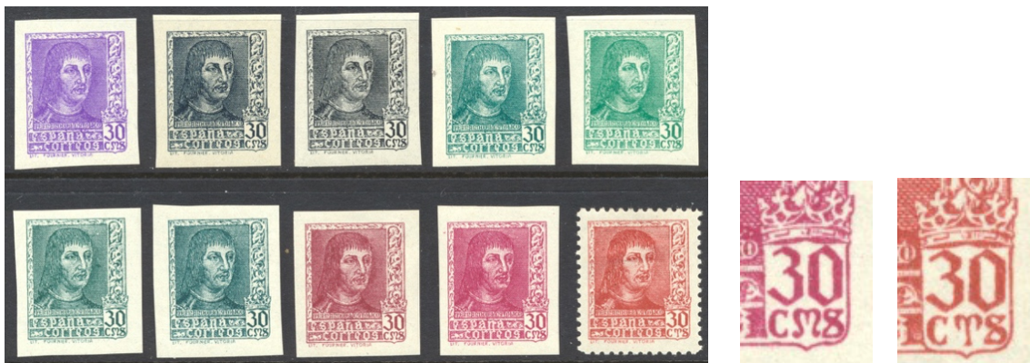
Afb. 38 Fernando el Católico (1938) Ed.844Aec/ecm

Bij de serie uit februari 1938, die werd opgedragen aan koning Fernando el Católico , is flink met kleuren geëxperimenteerd. Er zijn kleurproeven van vervaardigd in zo ongeveer alle kleuren van de regenboog, zoals te zien is in afbeelding 38. Deze proeven waren ongetwijfeld bedoeld voor de gehele serie van vier, maar men heeft daarvoor een enkel cliché gebruikt, dat van de 30 céntimos. Daarin staat ook nog eens een ontwerpfout: onder het waardecijfer staat 'CMS' in plaats van het veel gebruikelijker 'CTS'. Voor de 30 céntimos zelf kwam men tenslotte uit op rood , het getande exemplaar rechtsonder in de afbeelding.