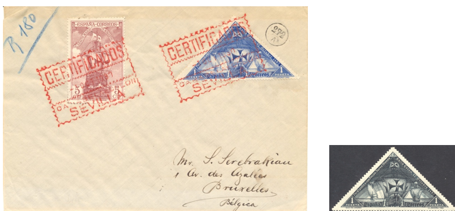
Afb. 56 Descubrimiento (1930) Ed.543cc op gelopen poststuk

Het aangetekende stuk naar Brussel in afbeelding 56 is gefrankeerd met een zegel van 5 céntimos uit de 'Descubrimiento' serie van 1930 en de 1 peseta uit dezelfde serie, maar dan wel de blauwe cc variant. Rechts prijkt de reguliere zwarte uitvoering. Het zal niet verbazen dat de geadresseerde de bekende postzegelhandelaar Souren Serebrakian is.