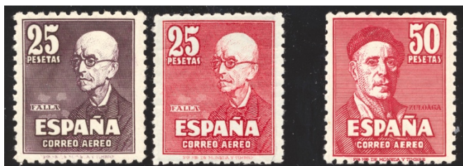
Afb. 53 Luchtpostserie (1947) Ed.1015/f, 1016

Een ander fraai voorbeeld staat in afbeelding 53. We zien links de lilabruine luchtpostzegel gewijd aan de componist Manuel de Falla uit 1947. Het exemplaar rechts ervan is in de kleur karmijn, die van de 50 peseta zegel uit dezelfde serie. De Edifil vermeldt deze als fantasía zonder verdere waarde aanduiding. Er bestaat ook een lilabruine versie van de 50 peseta's. Erbij staat verder vermeld dat deze zowel ongetand als getand voorkomen. De perforatie is dan van privé herkomst; de ongetande zegel zelf is dus kennelijk echt afkomstig van de F.N.M.T., die er ook op vermeldt staat. En die zijn dan toch om een of andere reden geen cc.