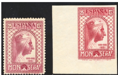
Afb. 28 Montserrat (1931) Ed.642/ccs

Het valt op dat, ruim een half jaar na het uitroepen van de Republiek, de veertien zegels waaruit de serie bestaat, en de vijf bijbehorende zegels voor de luchtpost, als landsnaam alleen 'ESPAÑA' vermelden. De oorzaak hiervan is dat ze reeds geruime tijd gereed waren, en dat de Republikeinse autoriteiten het uitkomen ervan enige tijd tegen hebben gehouden, en wel vanwege het uitgesproken religieuze karakter van de serie.[8] Van vijf waarden zijn cc bekend, die alle een nuance in kleur verschillen van de uiteindelijke keuzes. Ze komen getand en ongetand voor. In afbeelding 28 treffen we de kleurvariant van de 25 céntimos. De kleuren zijn rozelila voor het origineel en het subtiel verschillende karmijnrood voor de proef.