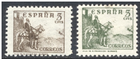
Afb. 37 Permanente serie II (1936) Ed. 816/ec

Bij de opvolger van deze serie, die twee maanden later, ook weer in Burgos, werd uitgegeven, zijn de gebouwen vervangen door de nationalistische iconen El Cid en koningin Isabel I. In de Edifil catalogus staat daarbij onder het kopje 'Color Cambiado' de zegel van 5 céntimos genoemd, in de afwijkende kleur groen (de definitieve kleur is bruin ). De codering is echter Ed.816ec. De vraag is weer: is de zegel een drukfout, of staat er een drukfout in de catalogus?