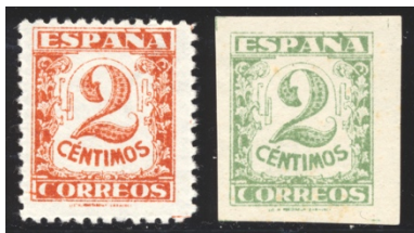
Afb. 36 Cifras (1936) Ed.803/cca

Voor het geval dat men zou hebben besloten met de traditie te breken en een rode 1 céntimo te laten verschijnen, probeerde men ook maar een kleurwisseling van de 2 céntimo uit. Die dan maar groen .