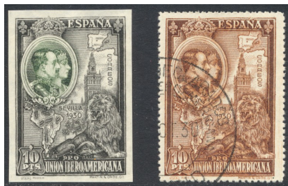
Afb. 19 Pro Unión (1930) Ed.581ccjs/581

Men was dus kennelijk wel heel besluiteloos ten aanzien van deze topwaarde. De meeste van de proeven zijn in één kleur gehouden, net als voor de overige waarden. Bij drie ervan is het medaillon met het portret van het koninklijk paar echter in een afwijkende kleur uitgevoerd. Een ervan staat in afbeelding 19: zwart en groen . Het tweekleuren ontwerp heeft het helaas niet gehaald, want het werd tenslotte egaal bruin . Het hier getoonde exemplaar is gestempeld, terwijl gebruikt als zodanig volgens de Edifil bij deze zegel niet voorkomt. Het stempel zal dan ook wel van het kaliber 'welwillend' zijn geweest. Zo niet, dan hebben we hier een kleine correctie voor de catalogus.