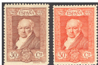
Afb. 11 Goya (1930) Ed.509/cc

Het eerstvolgende voorkomen van een cc vinden we bij de nog in dezelfde maand uitgegeven Goya -serie. Zo is er een kleurvariant voor de 30 céntimos. Deze is oranje , waar uiteindelijk voor bruin is gekozen. De kleur oranje komt verder voor bij de waarde 50 céntimos. Door deze koerswijziging zijn alle veertien zegels met het portret van de schilder verschillend van kleur. Wellicht een extra eerbetoon aan een van Spanjes grootste schilders.