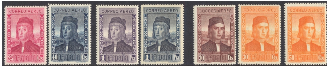
Afb. 16 Descubrimiento (1930) Ed.552/554, 556/556cc, 553/553cc/555

kapiteins van de twee andere schepen op de tocht. Aan de oudste van hen, Martín, kapitein van de 'Pinta', werden drie zegels opgedragen, die men links in de afbeelding vindt. Alleen van de 1 peseta waarde is er een kleurproef: de kleur werd uiteindelijk paars en niet zwartblauw ; blauw was al de 'verplichte' kleur voor de 40 céntimos. De jongste Pinzón, Vicente, de kapitein van de 'Niña', moest het met twee zegels doen. Er is een proef in oranje voor de 30 céntimos, maar die werd roodbruin , en het oranje ging tenslotte naar de 50 céntimos.