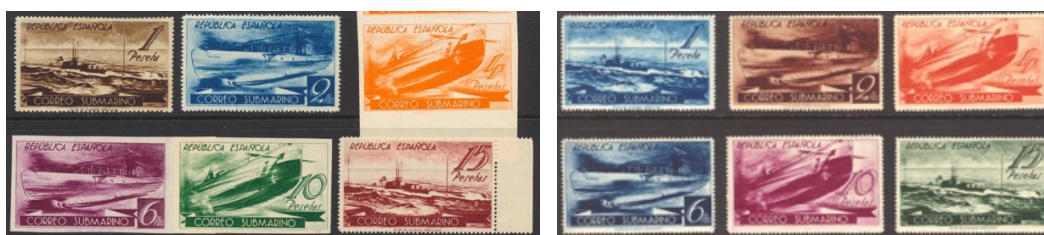
Afb. 34 Correo Submarino (1938) Ed.775/780cc, 775/780

De totale oogst aan cc voor de periode van de Tweede Republiek ten tijde van de Burgeroorlog staat in tabel 6.