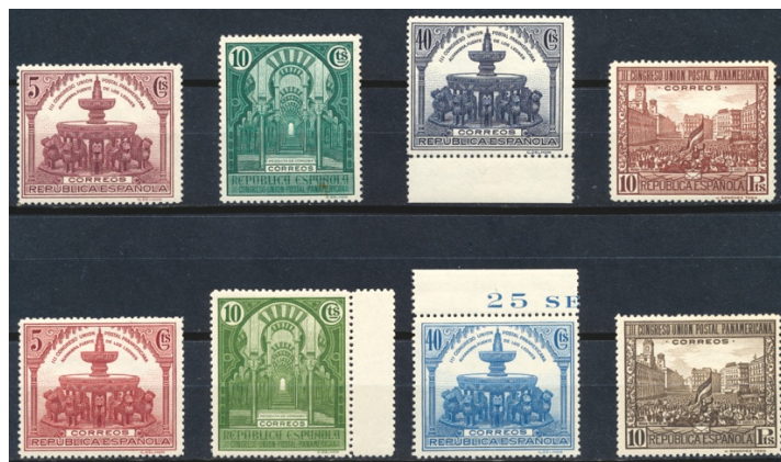
Afb. 22 III Congreso Postal U.P.P. (1931) Ed.604, 605, 609, 613 en cc

bij de serie voor het III Congreso de la Unión Postal Panamericana , verschenen in oktober 1931. Er waren weer deelseries voor gewone post en luchtpost. In afbeelding 22 zien we vier waarden van de serie voor de gewone post. Op de bovenste rij staan de zegels zoals ze zijn uitgegeven, en op de onderste enkele kleurproeven. Niet alleen de 10 ( groen ) en 40 ( blauw ) céntimos, waarvan de kleurkeuze beperkt was, maar ook de verder 'vrije' 5 céntimos en 10 peseta's verschillen slechts binnen de marges van een hoofdkleur.