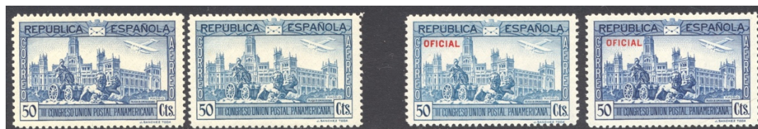
Afb. 24 III Congreso Postal Aéreo (1931) Ed.617/cc en 633/cc

Afbeelding 24 toont de luchtpostzegel van 50 céntimos uit deze serie, achtereenvolgens in de definitieve uitvoering ( blauw ), proef ( hemelsblauw ), met opdruk ( hemelsblauw ) en proef voor de opdruk ( blauw ). Hier kan men eigenlijk niet meer van reële kleurproeven spreken: de twee reeksen zijn als het ware elkaars cc. Het lijkt ook wel plausibel dat de kleuren zo in elkaars buurt werden gekozen.