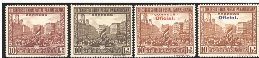
Afb. 26 III Congreso Postal (1931) Ed.613, 629, 613cca, 629hcc

De geschiedenis van de beide series voor de gewone post blijkt nog wat complexer te zijn. Zoals we in afbeelding 22 zagen is de zegel van 10 peseta's roodbruin , en bestaat er een proef in zwartbruin . Er is verder nog een kleurproef bekend in geelbruin , de kleur die voor de dienstopdrukzegel bedoeld was. Van die opdruk zelf, normaal rood , is ook nog een kleurproef in blauw . De vier exemplaren zijn te vinden in afbeelding 26.