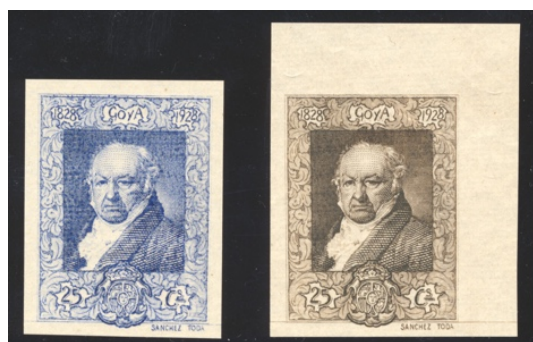
Afb. 13 Goya (1930) Ed.508ccas/ccbs(?)

Bij de 25 céntimos was de situatie anders. Dit was het brieftarief, dus moesten beide exemplaren de UPU kleur krijgen, en dat werd karmijn voor type I en vermiljoen van type II. Geen kleurproeven nodig, zou men zeggen. Toch wist ik de hand te leggen op de twee exemplaren in afbeelding 13. Dit zijn ongetande, ongegomde exemplaren van de 25 céntimos van type I. In 1928 was 25 céntimos reeds een aantal jaren het tarief voor een kaart, dus waarom deze twee kleuren – blauw en bruinzwart - zouden zijn overwogen is niet erg duidelijk. In de Filabo catalogus staan beide te boek als 'prueba de punzón', met nummers 507ppb en 507ppf.[7] Deze serie is geproduceerd door de Londense drukkerij van Waterlow & Sons. Wellicht was men daar niet op de hoogte van de diverse Spaanse tarieven, zodat aanvankelijk geen rekening werd gehouden met de UPU-voorschriften. De hier getoonde varianten worden overigens niet genoemd door de Edifil , dus vermoedelijk zien de redacteurs ze inderdaad als evenzovele grafeerproeven. Ik houd de cc optie toch nog even open.