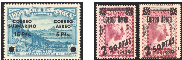
Afb. 52 Fantasías van Defensa en Montserrat (1938) Ed.757f, 791FN/FNa

Maar bij kleurvarianten als getoond in afbeelding 51, die qua afbeelding verder perfecte kopieën zijn van het origineel, is mij de status minder duidelijk. Komen ze van dezelfde drukkerij dan is het enige verschil met een echte cc mijns inziens dat ze geen officiële status hebben. Het is dan in feite aan de verzamelaar om ze al of niet als verzamelwaardig te beschouwen. Zolang ze maar niet als echte cc worden verkocht, met de bijbehorende (te hoge?) prijs.