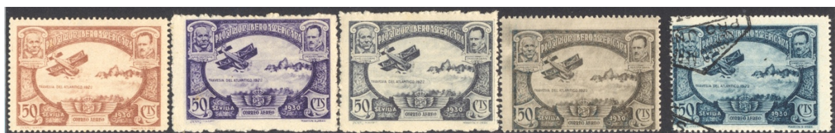
Afb. 20 Pro Unión Aéreo (1930) Ed.587cc/ccal/cccl/ccd, 587

De bijbehorende Pro Unión luchtpostserie kent ook de nodige experimentele versies. Bij de negen waarden waaruit hij bestaat behoren zestien getande en vijftien ongetande kleurproeven. Ik toon er enkele van de 50 céntimos, ditmaal getand: bruin , donkerpaars , leiblauw en grijs . Het eindresultaat is grijsblauw en staat rechts in afbeelding 20.