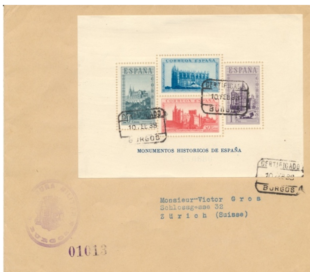
Afb. 58 'Monumentos históricos': Ed.848cc op gelopen poststuk

Een laatste voorbeeld van een ongetwijfeld bewust met een color cambiado gefrankeerd stuk staat in afbeelding 58. Het is het velletje dat we reeds lieten zien in afbeelding 41. Of Victor Gros in Zürich een postzegelhandel dreef heb ik niet kunnen achterhalen. Maar hij was vast niet de enige die een dergelijk stuk ontving, want de catalogus vermeldt – ongebruikelijk bij een cc – een prijs voor gestempeld. Het enige bewijs dat het niet om een welwillendheidsafstempeling gaat is de aanwezigheid op een brief die heeft gelopen gedurende de geldigheid van de erop geplakte zegels. En 10 februari 1938 was zelfs de Eerste Dag.