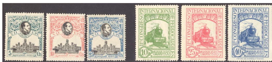
Afb. 3 Series Congreso UPU (1920) en Congreso de Ferrocarriles (1930)

Ook voor wat betreft de kleurstelling van de relevante zegels uit de gelegenheden uitgiften bleef men zo dicht mogelijk bij de regels, zelfs als het om meerkleurige uitgiften ging. In dat laatste geval werden de voorschriften toegepast op de kaders. Dat is te zien in afbeelding 3.