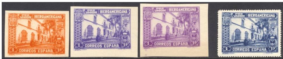
Afb. 17 Pro Unión (1930) Ed.578cc/cccs/ccds, 578

Bij de drie hoogste waarden – 1, 4 en 10 peseta's - heeft men het ruimste palet gecreëerd. Van de 1 peseta zijn er zes verschillende kleurproeven. Drie ervan staan in afbeelding 17: oranje , lila en paars . Het werd tenslotte paarsblauw .