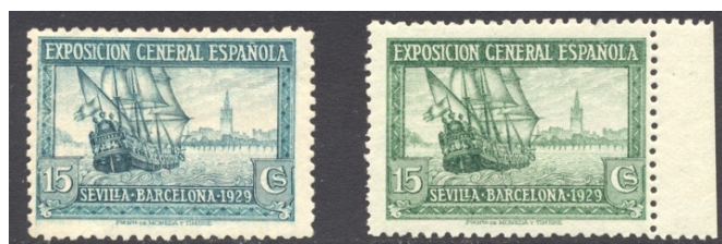
Afb. 7 Exposiciones Sevilla/Barcelona (1929) Ed.438/cc

Alhoewel we mogen aannemen dat er reeds eerder kleurproeven zullen zijn vervaardigd, treffen we de eerste cc in de catalogus aan bij de serie ter gelegenheid van de Wereldtentoonstelling van Sevilla-Barcelona in 1929. Maar dan is het meteen ook raak. Van de zegels voor de gewone post zijn er kleurproeven in de gebruikte kamtanding ( 11\frac{1}{4} ) voor de waarden 5 en 15 céntimos en 10 peseta's. In afbeelding 7 staat naast de definitieve versie van de 15 céntimos in de kleur blauwgroen de kleurproef in geelgroen . Deze zegel heeft een relatief hoog velnummer aan de gomzijde: A000,028. Als dit realistisch is, dan duidt dit op meer dan 1.000 proefexemplaren. Misschien had men op dat moment serieuzer voornemens met deze kleur.