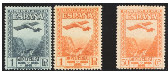
Afb. 29 Montserrat Aéreo (1931) Ed.654/cc, 653

Tot aan het uitbreken van de Burgeroorlog in juli 1936 treffen we in de catalogus nog maar één voorbeeld van een cc aan. Het gaat om de 10 céntimos uit de serie Españoles ilustres van 1933. Hierop vinden we het portret van Mariana Pineda, de eerste vrouw die vanwege haar eigen verdienste op een Spaanse postzegel verschijnt. Van alle zeven zegels waaruit deze serie bestaat zijn kleurnuances bekend, die echter alle gewoon over de toonbank zijn gegaan. Kennelijk beschikte men in die tijd niet over al te kleurvaste inktsoorten. Zo zijn van de 15 céntimos uit dezelfde serie drie varianten onder een nummer gecatalogiseerd die gemakkelijk als verschillende versies zouden kunnen gelden. De kleuren, als getoond in afbeelding 30, staan in de catalogus vermeld als respectievelijk leigrijs , groengrijs en blauwgroen .