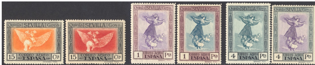
Afb. 14 Goya Aéreo (1930) Ed.520/cc, 526/cc, 528/cc

Diezelfde opmerking staat bij de proeven van de bijbehorende, in twee kleuren uitgevoerde luchtpostserie. Daarvan kan men zich wel wat beter voorstellen dat er met kleurencombinaties is geëxperimenteerd. Afbeelding 14 toont een drietal paren, met steeds eerst de definitieve uitvoering en dan de niet aangenomen kleurproef. De proeven, met hun grotere kleurcontrast, lijken sprekender dan de subtieler uitgevoerde definitieve versies, maar over smaak valt niet te twisten natuurlijk.