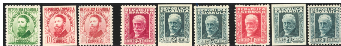
Afb. 21 Españoles ilustres (1932) Ed.664/ccs/cc, 667/ccs/cc, 669/ccs/cc

Van deze tweede reeks is een aantal ongetande cc bekend geworden. Zoals echter wel vaker het geval is met Spaanse zegels, hebben particulieren hier ook nog een duit in het zakje gedaan. Van een aantal kleurproeven van deze serie bestaan versies die door derden zijn nagetand. Voor zover ik weet zijn die niet aangetroffen op echt gelopen stukken, dus ze hadden een puur filatelistisch oogmerk. De juiste tanding 1\frac{1}{4} is daarbij toegepast, zij het hier en daar in een wat spitsere variant. Afbeelding 21 toont enkele voorbeelden. Links steeds het uiteindelijk uitgegeven zegel, telkens gevolgd door de twee proeven.