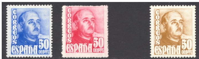
Afb. 54 Franco (1948) Ed.1022cc/cca en 1022

In mei 1948 verschijnt er weer een nieuw ontwerp voor de permanente Franco-zegel. Deze uitvoering oogste kennelijk weinig bijval, want hij werd vier maanden later alweer opgevolgd door nog weer een nieuwe uitvoering, die bekend staat als Franco y Castilla de la Mota . De eerder verschenen kortlevende serie kende slechts vier waarden: 5, 15, 50 en 80 céntimos. En alleen van de 50 céntimos zijn de twee kleurproeven bekend die zijn aan te treffen in afbeelding 54. Ze zijn uitgevoerd in lichtblauw en lichtkarmijnroze ; het werd uiteindelijk oker . De beide proefkleuren zijn niet voor een van de andere drie zegels uit de serie gebruikt.