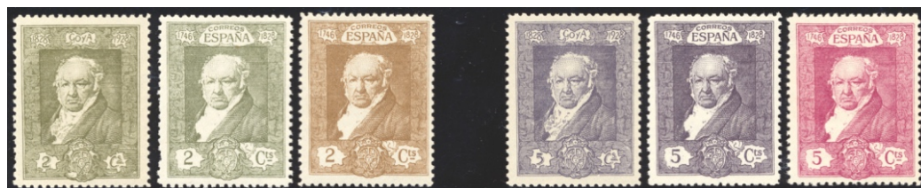
Afb. 12 Goya (1930) Ed.501/500cc/500, 503/502cc/502

Ik zal die eerdere versie type I noemen, en de versie van 1930 met de landsnaam type II. Van de 2 céntimos is type I olijfkleurig , naast het sepia van type II, en van de 5 céntimos is type I paars naast het lila van type II. Maar van beide types II zijn er proeven in de kleur van type I. Het lijkt er dus op dat men aanvankelijk overwoog om beide dezelfde kleur te geven, maar vervolgens heeft besloten toch maar een andere kleur te kiezen voor type II.