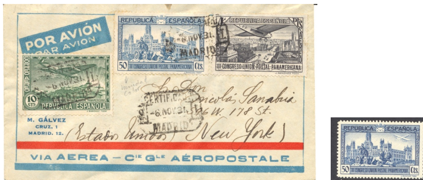
Afb. 57 III Congreso de la U.P.P. (1931) Ed.617cc op gelopen poststuk

céntimos en 4 peseta's treffen we de hemelsblauwe kleurproef van de 50 céntimos aan. De iets donkerder uitgevallen definitieve versie stond reeds in afbeelding 24, maar wordt hier ter vergelijking herhaald.