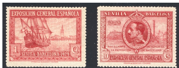
Afb. 8 Exposiciones Sevilla/Barcelona (1929) Ed.434ccp, 437ccp

Daarnaast zijn er van deze serie nog eens negen kleurproeven vervaardigd in fijnere tandingen ( 13\frac{3}{4} en 14 lijntanding). Vier daarvan zijn in de kleur karmijn . Twee stuks treft men aan in afbeelding 8: die voor de 1 en 10 céntimos. Beide hebben het voor een proef gebruikelijke rugnummer A000,000. Een andere indicatie dus dat het hier in elk geval om proeven gaat.