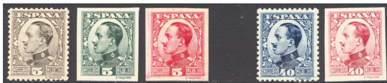
Afb. 10 Vaquer II (1930) Ed.491/ccs/ccas, 497/ecs\cc(?)

In juni 1930 verschijnt een herontwerp van de Vaquer -serie, nu met het portret van Alfonso XIII in profiel. Naast de 'error de color' die werd getoond in afbeelding 0 vermeldt de catalogus voor deze serie geen exemplaren van het type cc. Deze bestaan echter wel degelijk. Ik wist de hand te leggen op drie exemplaren. Links in afbeelding 10 staan twee versies van de zegel van 5 céntimos in de kleuren groen en karmijn , terwijl uiteindelijk werd gekozen voor zwartbruin . Rechts staat een karmijnlila variant van de 40 céntimos, de kleur die uiteindelijk bij de 30 céntimos terecht kwam; voor de 40 céntimos werd het blauw . Dat laatste was de 'verplichte' kleur, dus de karmijnlila zegel zou eerder gezien moeten worden als een kleurfout. Dat wordt dan weer tegengesproken door de ongetande status.