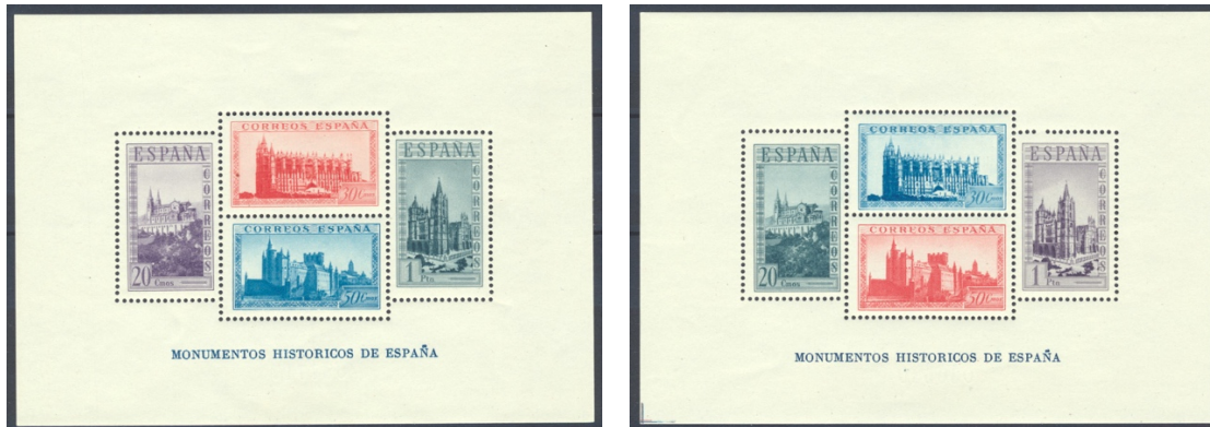
Afb. 41 Monumentos históricos (1938) Ed.848/cc

Koning Fernando el Católico en zijn gade koningin Isabel la Católica , samen bekend als de Los Reyes Católicos , ('de katholieke koningen') werden een icoon van de Nationalisten. Isabel was al verschenen op een aantal waarden van de permanente serie van 1937. Toch kreeg ze maanden na haar eega ook nog een geheel eigen serie in 1938. In tegenstelling tot die van Fernando als hierboven getoond zijn er van deze serie relatief weinig varianten bekend geworden. Zo vermeldt mijn versie van de Edifil Especializado geen enkele cc. Gezien de uiteindelijk gekozen kleuren van de zes zegels heeft men zich laten inspireren door de nogal gelijkvormige Fernando -serie en de daarbij vervaardigde kleurproeven. Toch kwam ik onlangs een proef tegen van de 40 céntimos in een kleur die afwijkt van de uiteindelijke paarse uitvoering. Ik houd het maar op leikleurig , de kleur van het derde Fernando -exemplaar op de bovenste regel in afbeelding 38. De proef, te zien in afbeelding 42, verdient mijns inziens een eigen catalogusvermelding. De Filabo vermeldt hier tenminste geen ' prueba de punzón '.