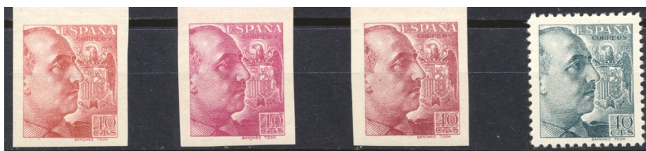
Afb. 45 Franco y Escudo de España (1939) Ed.870ccs/ccas/ccbs/870

Op 28 april 1939, vier weken na het einde van de Burgeroorlog, verschijnt de eerste serie met het portret van dictator Franco. Hij liet er dus al snel geen twijfel over bestaan wie het voortaan voor het zeggen had in de Spaanse Staat. Van de twaalf verschillende waarden van deze serie zijn er kleurproeven voor een viertal, getand en ongetand: een voor de 25, 45 en 60 céntimos, en drie voor de 40 céntimos: roodbruin , aalbesrood en roze . Deze laatste staan in afbeelding 45, in de ongetande uitvoering. Geheel rechts staat het definitieve, zoveel saaier grijsgroene exemplaar.