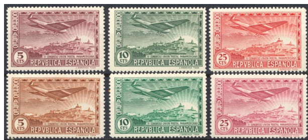
Afb. 23 III Congreso Postal Aéreo (1931) Ed.614, 615, 616 en cc

De drie laagste waarden staan in afbeelding 23, met de definitieve zegels weer op de bovenste rij.