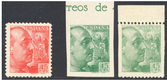
Afb. 46 Franco y Escudo de España (1939) Ed.871/cc/ccsv

Een tweede uitgifte op basis van dit ontwerp zag het licht in december van datzelfde jaar. Dit zou nog vijf jaar lang de permanente zegel blijven. De tweede versie behield enkele waarden in dezelfde kleur, zag verandering daarin bij andere waarden, en kreeg er drie lage waarden bij. De catalogus vermeldt cc voor drie waarden ervan – de 25 en 50 céntimos en de 10 peseta's. De 25 céntimos werd uitgevoerd in de kleur karmijnlila . Er zijn twee kleurproeven van deze waarde: roodbruin en parelgrijs . Van de roodbruine variant kennen we een ongetande versie, een in de gebruikte tanding 9\frac{1}{2} bij 10\frac{1}{4} en een in de fijnere proeftanding 14. Er is dus aardig mee geëxperimenteerd.