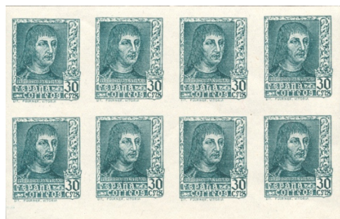
Afb. 39 Fernando el Católico (1938) veldeel groenblauw Ed.844Aecg

en gegomd, en pas op het postkantoor of nog later tegen de lamp lopen. Van dit exemplaar zijn niet 'per ongeluk' al deze kleuren geproduceerd. Het zijn volgens mij ook geen 'pruebas de punzón', want er zijn hele vellen van bekend, als te zien aan het veldeel in afbeelding 39.