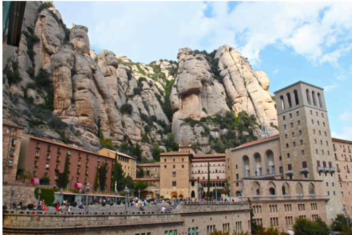
Afb. 27 Het klooster van Montserrat

In december 1931, twee maanden na het uitkomen van de Congreso Postal U.P.P. serie, verschijnt de serie opgedragen aan het Monasterio de Montserrat , het klooster hoog in de bergen ten Noordwesten van Barcelona, dat 900 jaar eerder werd gesticht.