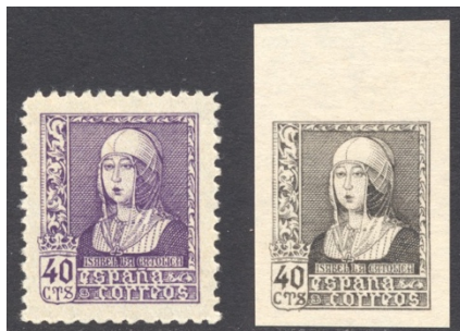
Afb. 42 Isabel la Católica (1938) Ed.858/ccs(?)

Koning Fernando el Católico en zijn gade koningin Isabel la Católica , samen bekend als de Los Reyes Católicos , ('de katholieke koningen') werden een icoon van de Nationalisten. Isabel was al verschenen op een aantal waarden van de permanente serie van 1937. Toch kreeg ze maanden na haar eega ook nog een geheel eigen serie in 1938. In tegenstelling tot die van Fernando als hierboven getoond zijn er van deze serie relatief weinig varianten bekend geworden. Zo vermeldt mijn versie van de Edifil Especializado geen enkele cc. Gezien de uiteindelijk gekozen kleuren van de zes zegels heeft men zich laten inspireren door de nogal gelijkvormige Fernando -serie en de daarbij vervaardigde kleurproeven. Toch kwam ik onlangs een proef tegen van de 40 céntimos in een kleur die afwijkt van de uiteindelijke paarse uitvoering. Ik houd het maar op leikleurig , de kleur van het derde Fernando -exemplaar op de bovenste regel in afbeelding 38. De proef, te zien in afbeelding 42, verdient mijns inziens een eigen catalogusvermelding. De Filabo vermeldt hier tenminste geen ' prueba de punzón '.