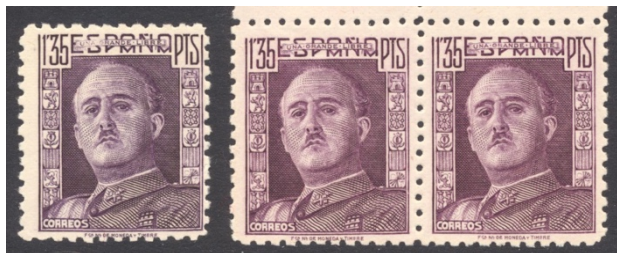
Afb. 50 Franco de frente (1942) Ed.1001/cc

In 1946 verschenen drie aanvullende waarden bij de permanente Franco-serie van de afbeelding 45 t/m 47, maar in een nieuw ontwerp. Hier kijkt de dictator ons rechtstreeks in de ogen.[12] Van twee waarden zijn er kleurproeven, getand en ongetand. Van de blauwe 75 céntimos is er een proef in geelgroen , en van de paarse 1,35 peseta bestaan er varianten in magenta , vermiljoen en karmijn . Van die laatste waarde staat een voorbeeld in afbeelding 50, in de vorm van een getand paartje.