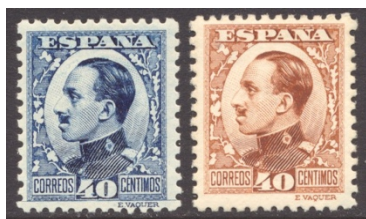
Afb. 6 Vaquer II (1930) Ed.497/ec

Het gaat hier dus niet om proeven, bewust vervaardigd om tot een juiste kleurkeuze te kunnen komen, maar om heuse drukfouten, die tot de meer kostbare stukken van de Spaanse filatelie behoren. Ze zijn onbedoeld in de verkoop gekomen, en soms zelfs uitsluitend afgestempeld bekend geworden, zoals het exemplaar in afbeelding 4. Het type 'ec' is daarom normaliter getand. Vermoedelijk als gevolg van verbeterde druktechnieken komt deze drukfout gaandeweg steeds minder voor. Een van de meer recente exemplaren die ik ken is een zegel uit de Vaquer -serie van 1930, getoond in afbeelding 6. De voor de 40 céntimos gekozen kleur is blauw , de door de UPU voorgeschreven kleur, en niet lichtbruin .