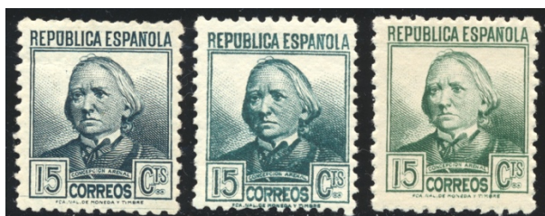
Afb. 30 Españoles ilustres II: Concepción Arenal (1936) Ed.683/a/b

Tot aan het uitbreken van de Burgeroorlog in juli 1936 treffen we in de catalogus nog maar één voorbeeld van een cc aan. Het gaat om de 10 céntimos uit de serie Españoles ilustres van 1933. Hierop vinden we het portret van Mariana Pineda, de eerste vrouw die vanwege haar eigen verdienste op een Spaanse postzegel verschijnt. Van alle zeven zegels waaruit deze serie bestaat zijn kleurnuances bekend, die echter alle gewoon over de toonbank zijn gegaan. Kennelijk beschikte men in die tijd niet over al te kleurvaste inktsoorten. Zo zijn van de 15 céntimos uit dezelfde serie drie varianten onder een nummer gecatalogiseerd die gemakkelijk als verschillende versies zouden kunnen gelden. De kleuren, als getoond in afbeelding 30, staan in de catalogus vermeld als respectievelijk leigrijs , groengrijs en blauwgroen .